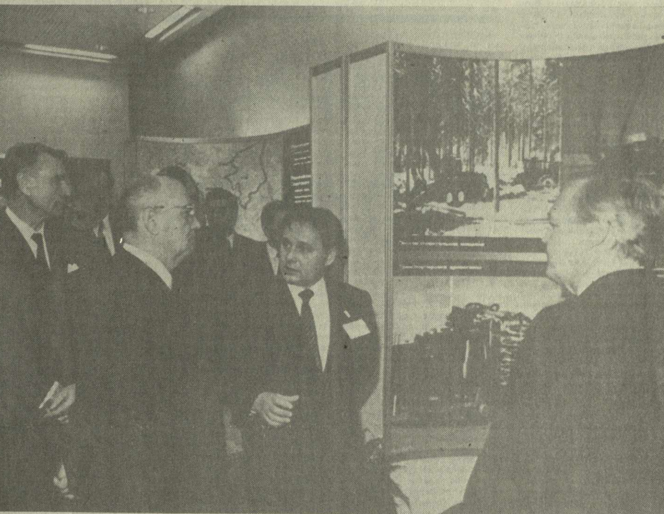
На снимке: ознакомление в гостинице «Каластаяторппа» с выставкой финской промышленности.

межправительственные меморандумы об учреждении в советской столице Дома Финляндии, об упрощении визовых процедур, соглашениях о товарообороте и планах на 1991 — 1995 гг., Протокол о сотрудничестве на Кольском полуострове, Договор о социальном обеспечении в области охраны окружающей среды и в области туризма, документы о создании совместных предприятий и ряд других.