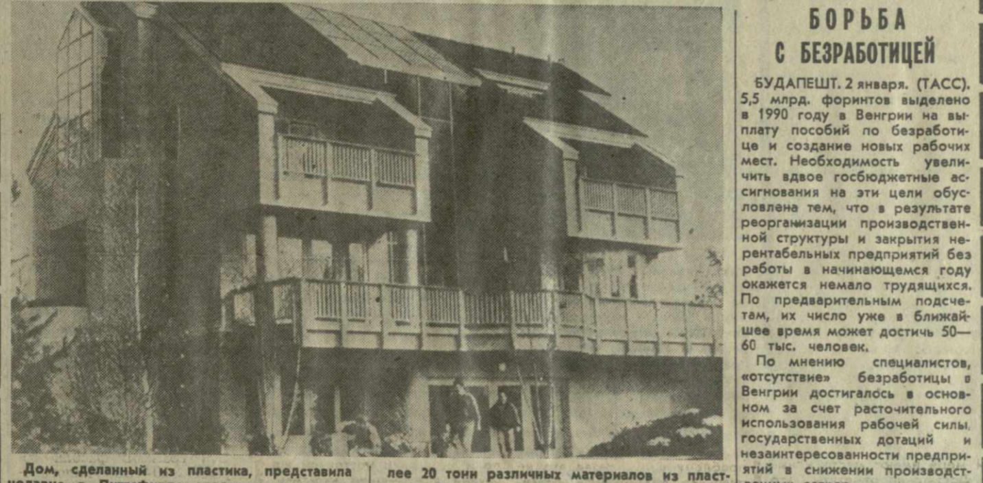
Дом, сделанный из пластика, представлял недавно в Питтсфилде известная американская корпорация «Дженерал» электроники. По мнению фирмы, таким образом она пытается разрабатывать концепцию среды жилого обитания человека в будущем. На строительстве фундамента, стен, крыши, оконных рам, создание систем водо- и электроснабжения, а также некоторых механических приспособлений было израсходовано более 20 тонн различных материалов из пластмасс. В доме, естественно, есть жилые комнаты, ванна, кухня, и даже — бассейн и солярий. И все же... Концепция концепцией, но будет ли удобно и приемлемо для здоровья жить человеку в таких вот домах из полимеров, покажет, наверное, только опыт. А пока пластиковый дом «Дженерал» будет служить своеобразной лабораторией.

БОРЬБА С БЕЗРАБОТИЦЕЙ БУДАПЕШТ. 2 января. (ТАСС). 5,5 млрд. форинтов выделено в 1990 году в Венгрии на выплату пособий по безработице и создание новых рабочих мест. Необходимость увеличить вдвое государственные ассигнования на эти цели обусловлена тем, что в результате реорганизации производственной структуры и закрытия нерентабельных предприятий без работы в наступающем году окажется немало трудящихся. По предварительным подсчетам, их число уже в ближайшем времени может достигнуть 50—60 тыс. человек. По мнению специалистов, «отсутствие» безработицы в Венгрии достигнуто в основном за счет расточительного использования рабочей силы, государственных дотаций и неэкономности предприятий в снижении производственных затрат. В соответствии с четвертьлетней программой «создания» дотаций предостанит закрыть многие предприятия горнорудной и металлургической промышленности, а формирование рыночной экономики вынуждает предприятия идти на рационализацию производства и сокращение излишних рабочих мест. К середине 90-х годов численность безработных в стране может составить 300—400 тыс. человек. Венгерское правительство намерено оказать помощь нуждающимся в трудоустройстве прежде всего за счет создания новых рабочих мест, переквалификации кадров и поощрения предпринимательства.