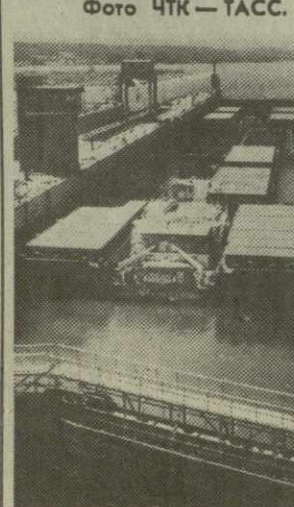
СРР. «Железные ворота» — символ сотрудничества социалистических стран. Этот мощный комплекс на Дунае, куда входит кроме гидроэлектростанции и навигационная система, сооружеено совместно румынскими и югославскими строителями при техническом содействии СССР. На снимке: один из шлюзов гидрокомплекса «Железные ворота-2».