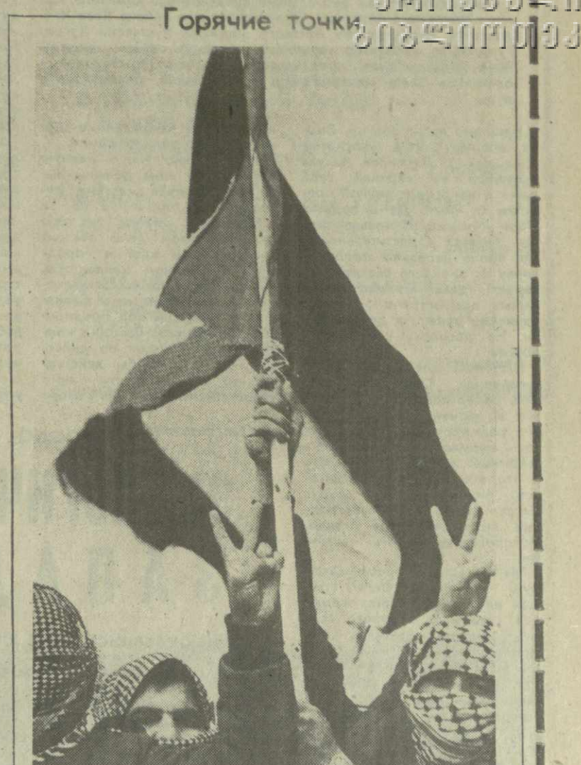
На снимке: массовые манифестации в знак протеста против произвола и насилия диктаторов прошли по всем оккупированным арабским территориям. Во многих городах и населенных пунктах манифестации переросли в ожесточенные столкновения демонстрантов с израильскими войсками, неоднократно отрывавшими автоматный огонь. Фотохроника ТАСС.