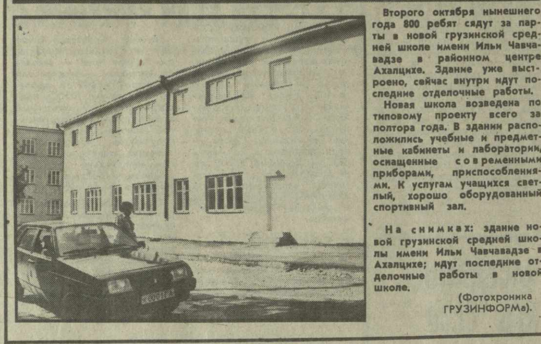
Второго октября нынешнего года 800 ребят съезду за партию в новой грузинской средней школе имени Ильи Чавчавадзе в районном центре Ахалцихе. Здание уже построено, сейчас внутри идут последние отделочные работы. Новая школа возведена по типовому проекту всего за полтора года. В здании расположены учебные и предметные кабинеты и лаборатории, оснащенные современными приборами, приспособлениями. К услугам учащихся светлый, хорошо оборудованный спортивный зал.