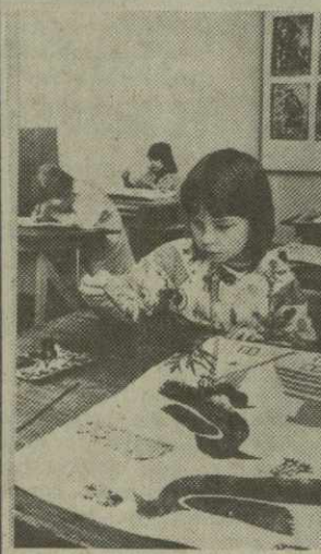
ЧССР. Народные школы искусства, которых в Чехословакии насчитывается около пятисот, являются центрами воспитания подрастающего поколения. На снимке: урок живописи в народной школе искусства города Пардубице.