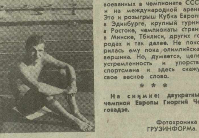
На снимках: двукратный чемпион Европы Георгий Чоговадзе.

В первый раз это произошло в августе 1987 года в Страсбурге. Здесь Георгий выдержал серьезную конкуренцию со стороны представителя ГДР Яна Хемпеля, которого опередил только лишь после высшего прыжка, и завоевал первое место. Ныне в Бонне, еще более ловиском мастерство, став более опытным, он лидировал после первого же прыжка и уверенно