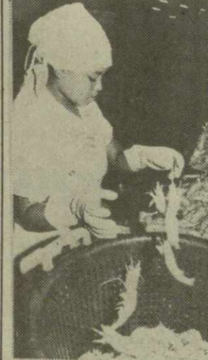
КУБА. Экспорт рыбы, креветок, лангустов является одним из важных источников валютных поступлений Кубы. На снимке: в цехе рыбного комбината в Сьенфугоесе.