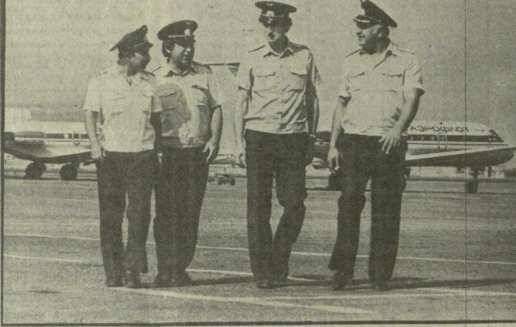
Высоких производственных показателей в своем нелегком летном труде добиваются авиаторы республики.