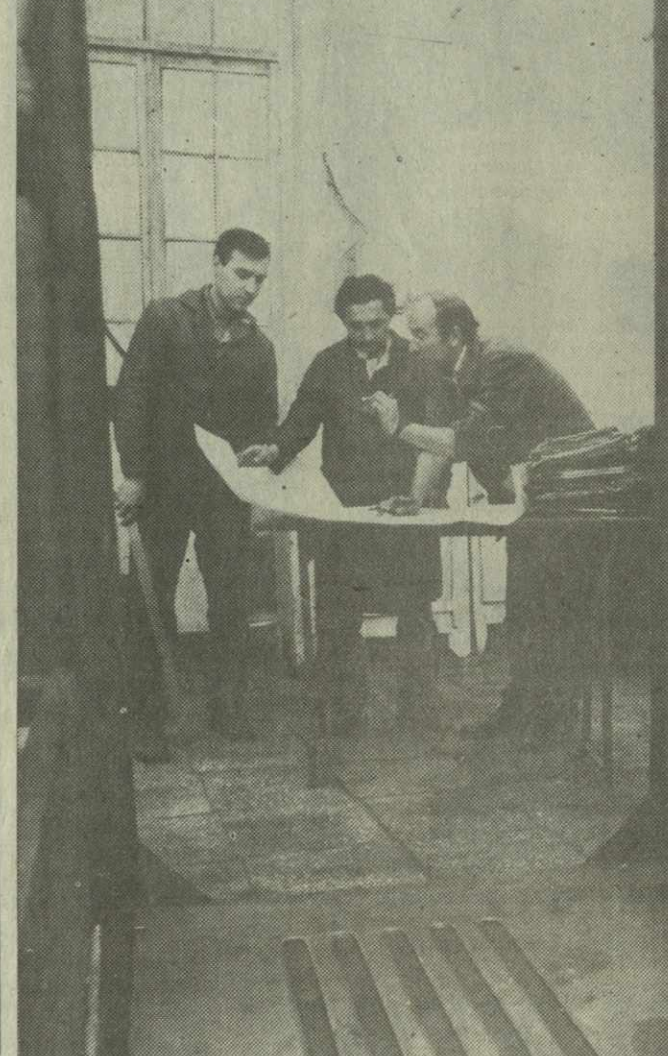
Записал Валерий БУДУМЯН, (Спец. корр. «Заря Востока»).