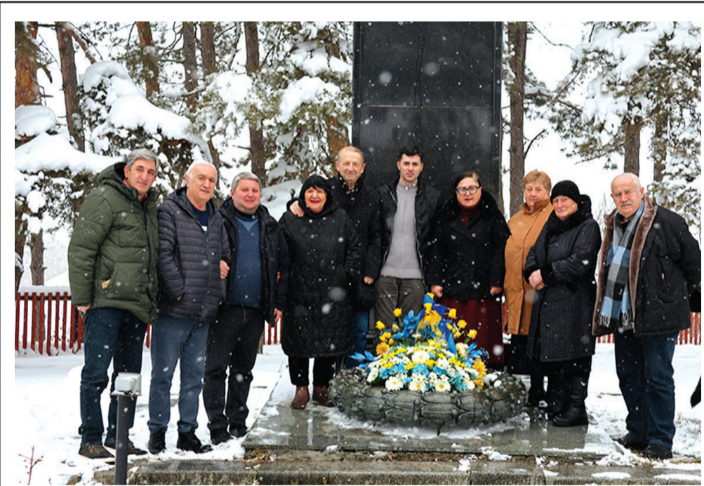
ლესია უკრაინკას დაბადების 154 წლის იუბილესთან დაკავშირებით, მუნიციპალიტეტის წარმომადგენლებმა, დაბა სურამში, პოეტის ბიუსტი ყვავილებით შეამკეს.