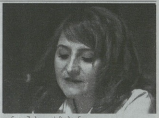
თუნდაც მუბლი ცას მიბავციო, გული თუ ვერ ხედავს მზეს.

შენ მბატოვე შიბა და ზღვა და ვერ იფრებ? როგორ ბანაობდი შის ქომბილი ბოშობანი ერთობა, დნურობდა სიყვარული და სიცოცხლე. შენ მბატოვე გზა და ნამბე-ნამბე გაზომე ნაპირი, წამიდა ტალღების ქართან წერწილი, მეგანამ გსურდა, ვადგე როგორ იცხვობო... რადგან კლდეზეც ცოცვა, ან ზეღავნი ცურვა არ არის საკმარისი იმისათვის, რომ მიწანელობს მიწილი ცოცხლად ყოფის სისარულობი,