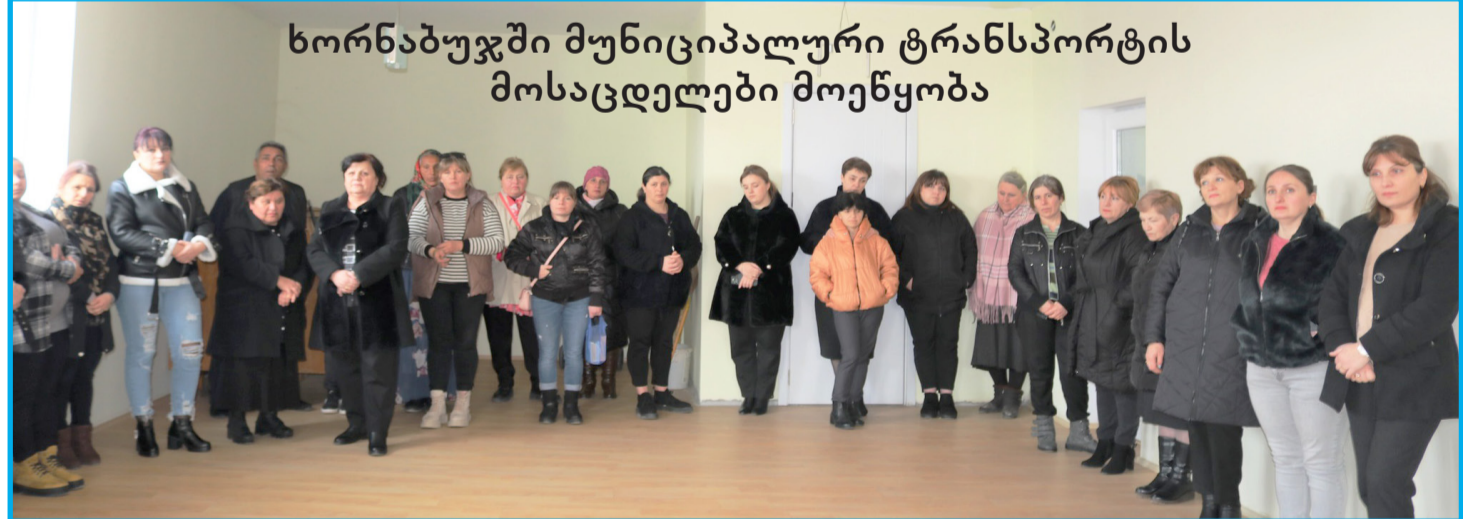
ხორნაბუჯში მუნიციპალური ტრანსპორტის მოსაცდელის მოწყობა

გვედოს და მოსახლეობის პულსაციას ვგრძნობდით, რათა უფრო ოპერატიული ვიყოთ. ყოველდღიურობას ახალ-ახალი გამონვებები მოაქვს და ეს ურთიერთობები ჩვენთვის მნიშვნელოვანია. ეს დამოკიდებულება შესაძლებლობას გვაძლევს, არჩევნების მოახლოების დროს წინასაარჩევნო შეხვედრების ფარგლებში უფრო თამამად მივიდეთ მოსახლეობასთან და თანადგომა ვთხოვთ. ყველა განვლილმა