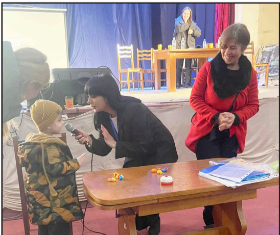
დონე და მათი განვითარების ეტაპები 0-დან 7 წლამდე“.

როგორც დედოფლისწყაროს სკოლამდელ სალმზრდელი ცენტრში აცხადებენ, ამ პროექტის საშუალებით მშობლები და ბავშვის მასწავლებლები გაეცნენ ბავშვის განვითარების ეტაპებს, ქცევებსა და მეტყველების სპეციფიკას და გარემოს მოწყობას.