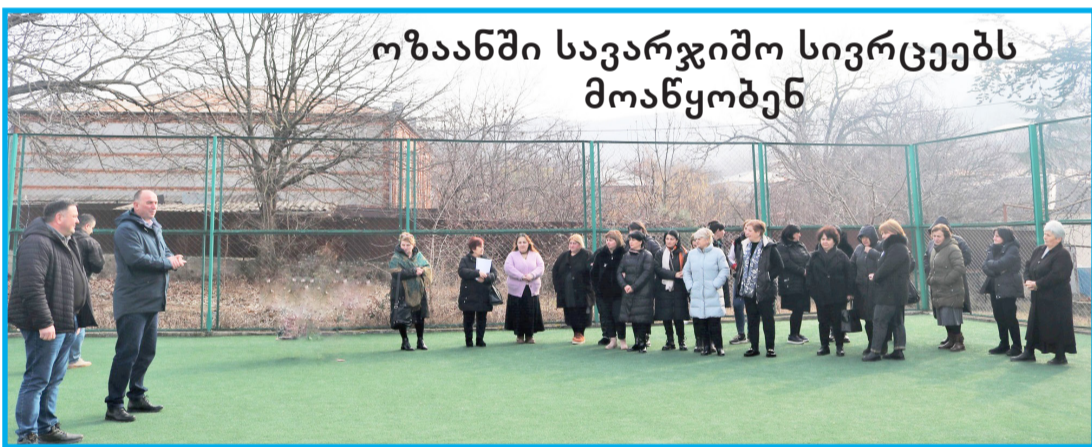
ოზანში სავარჯიშო სივრცეებს მოაწყობენ

იმ საკითხზე და თავადაც გვიზიარებენ საკუთარ იდეებს და პრობლემებს. ინფორმაციის ურთიერთგაცვლა ყოველწლიურად ხდება და სოფლის პროგრამას ყოველთვის გავცდებით ხოლმე. ჩვენთვის ეს კრებები საუკეთესო საშუალებაა, რომ საზოგადოების მაჯისცემაზე ხელი