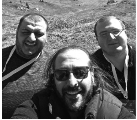
ლონისძეობა, რომლის საპრიზო ფონდიც შეადგენს 100.000 ლარს.

შეუძლებელია არ აღინიშნოს ის ზღაპრული ბუნება, რომელიც იაპორინაზე დაგვხვდა. ამ კურორტმა 1984 წლის ზამთრის ოლიმპიურ თამაშებს უმასპინძლა და იქ არსებული ინფრასტრუქტურა მაქსიმალურად იყო ასოცირებული ზამთრის სპორტთან. ჩვენი აქ დაწყებული მოგზაურობა კი სარაევოს 4 დღიანი ტურით დასრულდა. საერთო ჯამში ბოსნია-ჰერცეგოვინაში გატარებული დღეები იყო დადებითი ემოციებით აღსავსე და საინტერესო. რაც მთავარია - კიდევ ერთხელ გავაცანით საერთაშორისო პრაქტიკას, მივიღეთ გარკვეული გამოცდილება, გავიცანით არაერთი ადამიანი, რომელთანაც მომავალში შესაძლოა შედგეს მნიშვნელოვანი თანამშრომლობა და ა.შ. მიზნები ნამდვილად დიდი გვაქვს - გვსურს ქვეყანაში საბოლოოდ დავამკვიდროთ კიბერსპორტი, როგორც კულტურა, ამიტომაც ვმუშაობთ აქტიურად საზოგადოების ცნობიერების ამაღლებისთვის. ვგეგმავთ სხვადასხვა სახის გადაცემებისა და პოდკასტების დაწყებას. უკვე რამდენიმე თვეა აქტიურად ვთანამშრომლობთ უნივერსიტეტებთან, ხოლო რაც ყველაზე მთავარია უკვე ზედიზედ მეოთხედ - დეკემბრის თვეში გაიმართება წლის შემაჯამებელი კიბერსპორტული