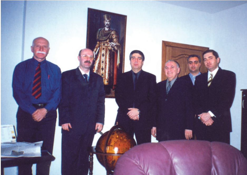
უკრაინაში საქართველოს საელჩოში.