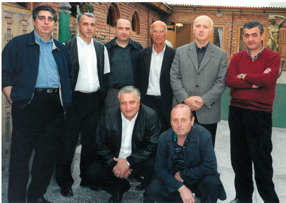
საფეხბურთო კლუბ „მერცხალის“ შემომწირველების ერთი ჯგუფი