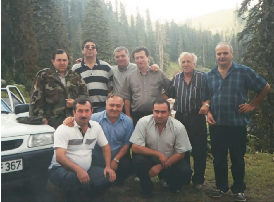
ოზურგეთელ მეგობრებთან ერთად ბახმაროში