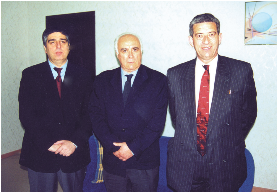
ინტერპოლის პრეზიდენტთან (ესპანეთის შს მინისტრი) გესუს ესპირაგეს მირასა და ვიცე-პრეზიდენტთან ჯონ აბოტისთან ერთად. 2001