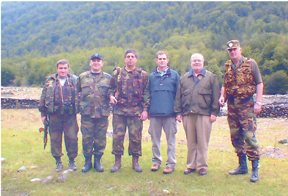
აშშ-ს ყოფილი ელჩი საქართველოში რიჩარდ მაილსი და აშშ-ს საელჩოს რეგიონალური უსაფრთხოების მაშინდელი უფროსი გრეგ ოლმსტედი ომალოში.