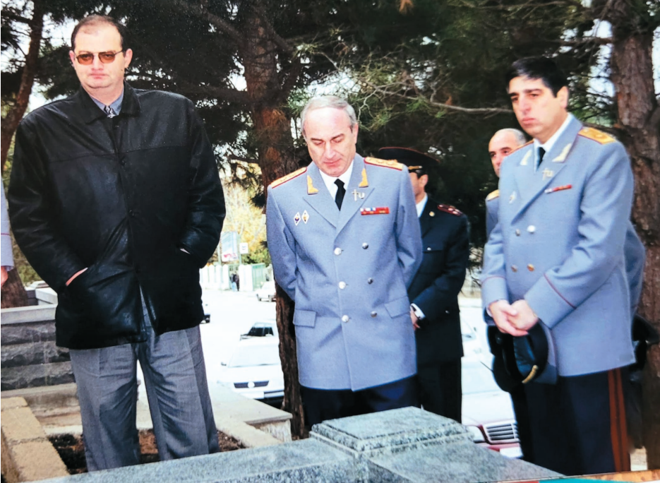
საქართველოს გენერალურ პროკურორთან გია მეფარიშვილთან და შს მინისტრთან კახა თარგამაძესთან ერთად