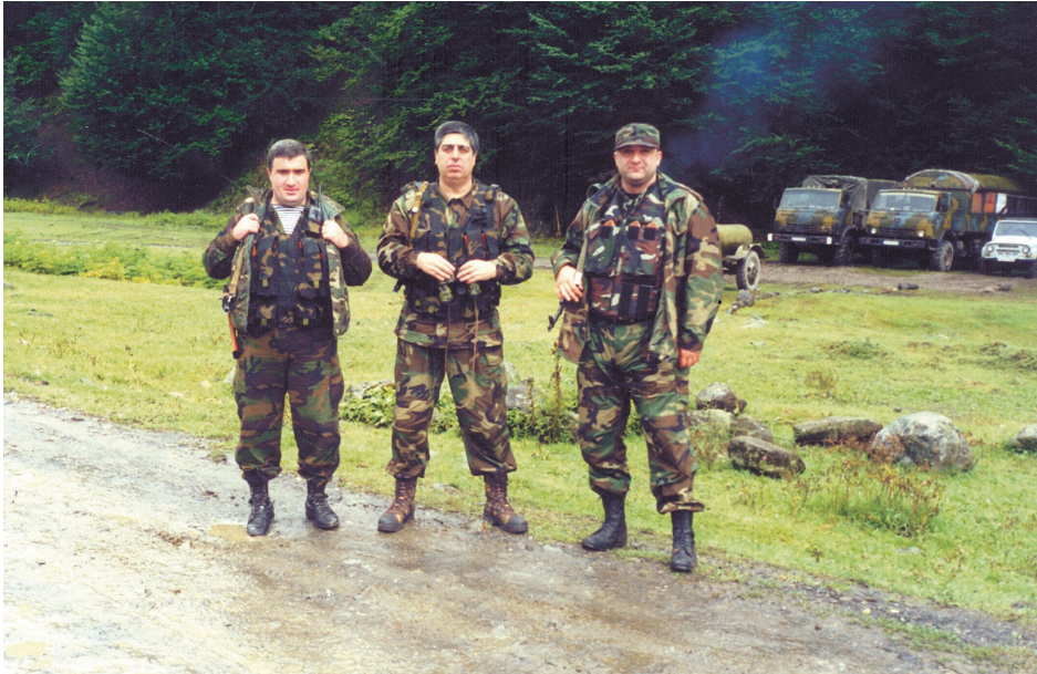
სპეცოპერაციის დროს ომალოში