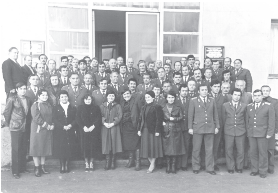
მასხრაძის მილიციის რაიგანყოფილების პირადი შემადგენლობა. 1982