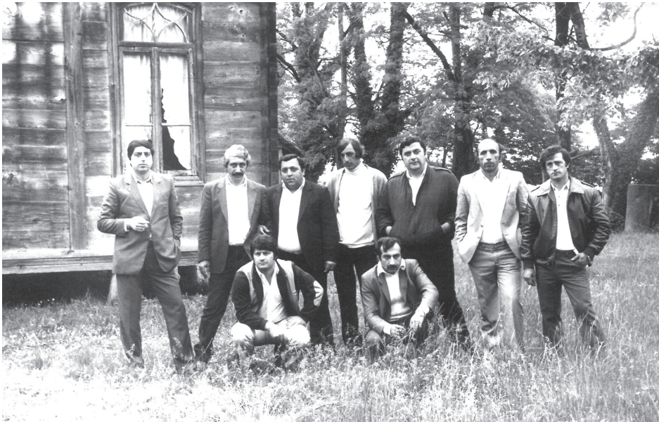
თანაკლასელებთან ერთად „ბაზვის მანიფესტის“ მემორიალის ეზოში. 1990