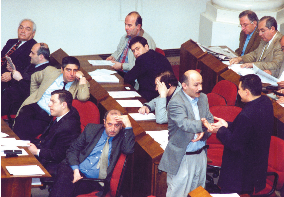
საქართველოს პარლამენტში. 1999-2000