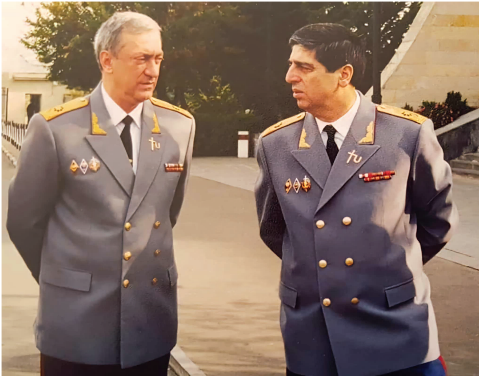
შს მინისტრის მოადგილე ზურაბ უროტაძესთან ერთად