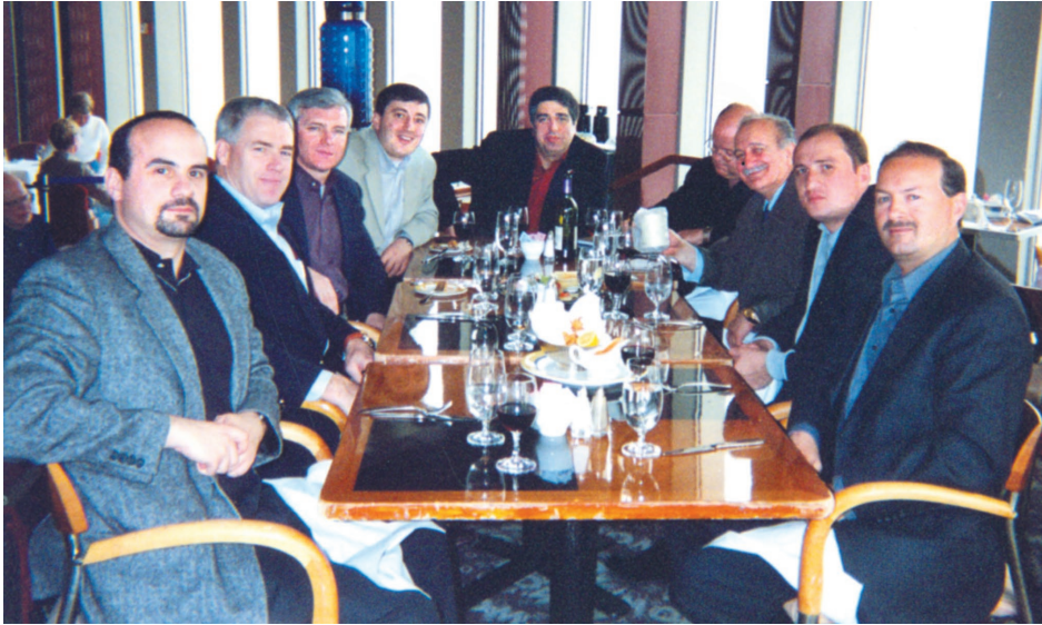
შეხვედრაზე აშშ გამოძიების ფედერალური ბიუროს ხელმძღვანელებთან. ნიუ-იორკი. 2001