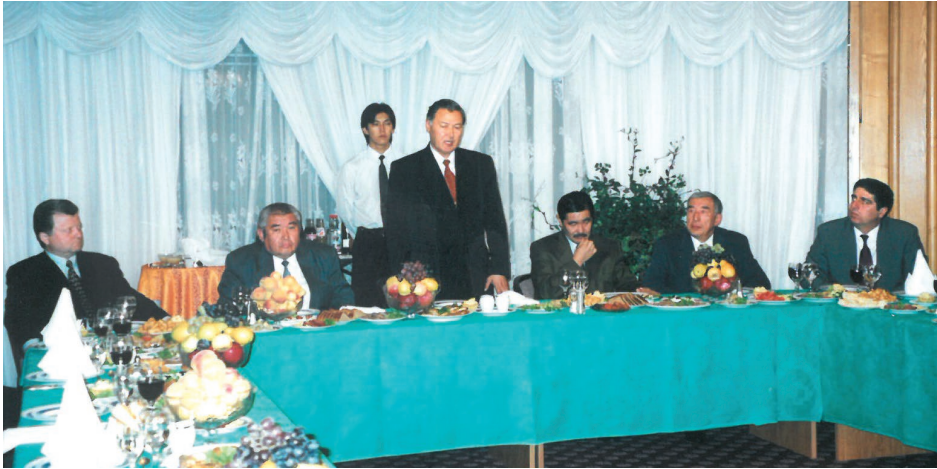
ღსთ ქვეყნების სამიტი ბიშკეკში. 2000