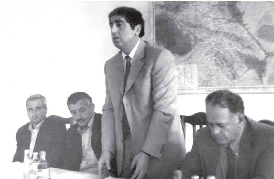
ოპერატიული თათბირი სამეგრელოში, ელგუჯა ჯამბურიას და თამაზ ალანიას თანამდებობებზე წარდგენა. მარჯვნიდან პირველი – პრეზიდენტის რწმუნებული სამეგრელოში ბონდო ვიქია. 2000