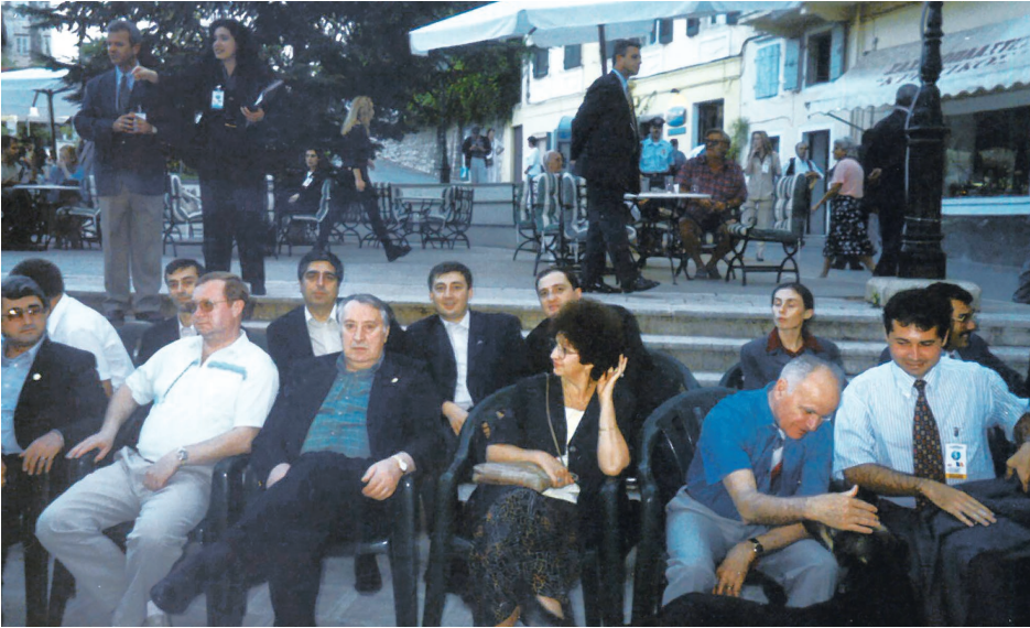
საბერძნეთში შავი ზღვის აუზის ქვეყნების შინაგან საქმეთა მინისტრების შეხვედრაზე. ცენტრში: შს მინისტრის პირველი მოადგილე ჯიმი მიქელაძე, რუსეთის შს მინისტრი სერგეი სტეპაშინი, სომხეთის შს მინისტრი (შემდეგში სომხეთის პრეზიდენტი) სერჟ სარქისიანი. 1998