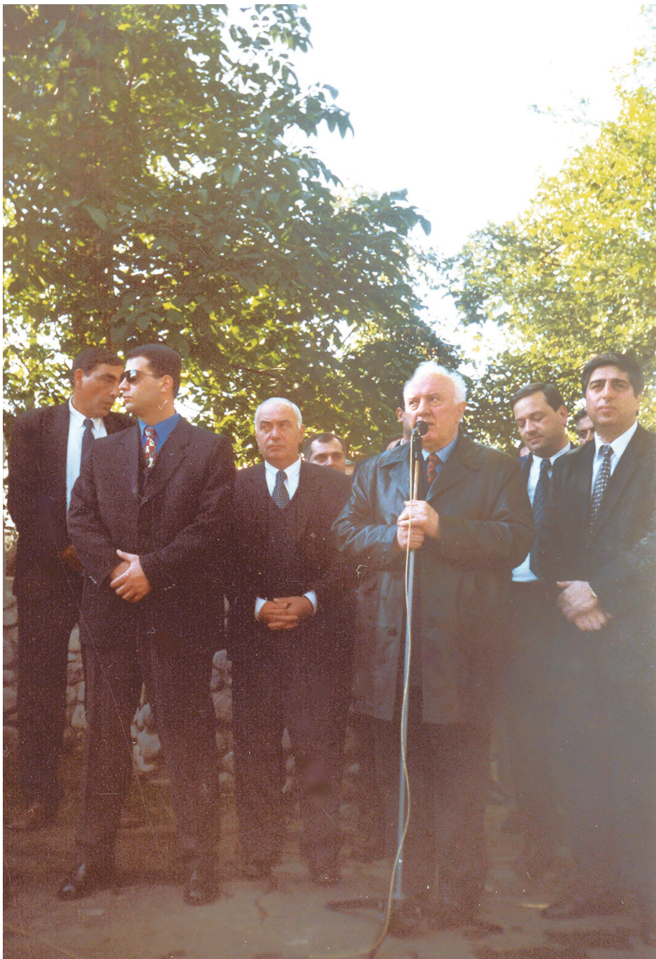
ედუარდ შევარდნაძე ექვთიმე თაყაიშვილის მუზეუმ-ნაკრძალის გახსნაზე ქ. ოზურგეთში. 1999