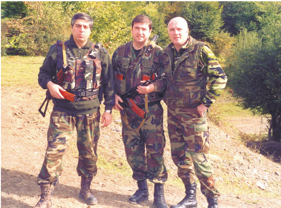
სპეცოპერაციის დროს ოძალოში