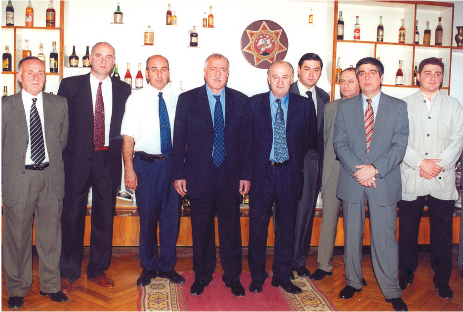
თურქეთის შს მინისტრთან ერთად. 2000