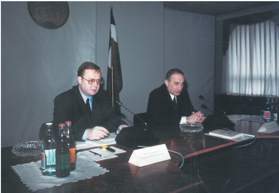
რუსეთის შს მინისტრი სერგეი სტეპაშინი და საქართველოს შს მინისტრი კახა თარგამაძე, 1999