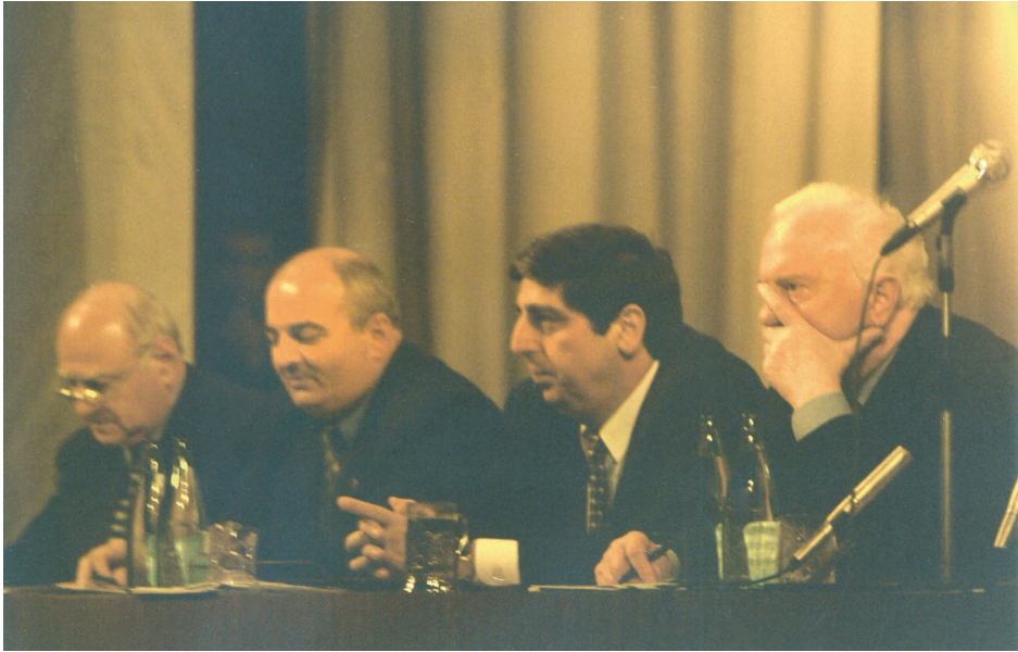
წინასაარჩევნო შეხვედრა ოზურგეთში. მარჯვნიდან: ედუარდ შევარდნაძე, ჩოხატაურის რაიონის მაჟორიტარი დეპუტატი დავით ჟღენტი, ლანჩხუთის რაიონის მაჟორიტარი დეპუტატობის კანდიდატი თამაზ კუნჭულია. 1999