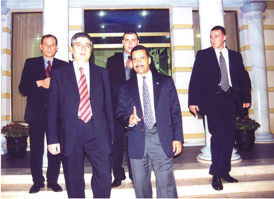
ინტერპოლის გენერალური მდივანთან რონალდ ნობელთან ერთად. 2001