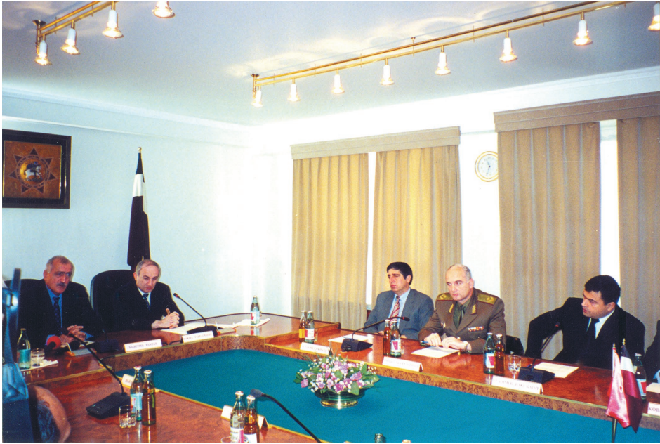
თურქეთის შს მინისტრის სადელტდინ თანთანის ვიზიტი. 2000