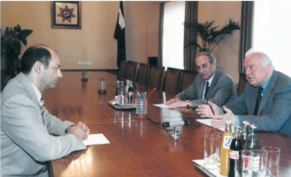
რუსეთის შს მინისტრის ვლადიმერ რუშაილოს შეხვედრა საქართველოს პრეზიდენტთან ედუარდ შევარდნაძესთან და შს მინისტრთან კახა თარგამაძესთან. 1999