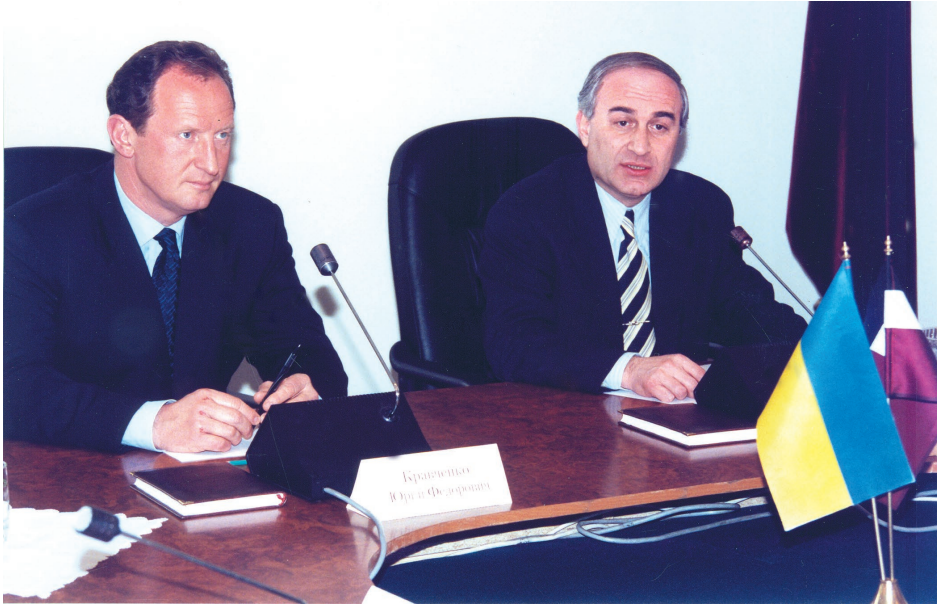
უკრაინის შს მინისტრი იური კრავჩენკო და საქართველოს შს მინისტრი კახა თარგამაძე, 1999