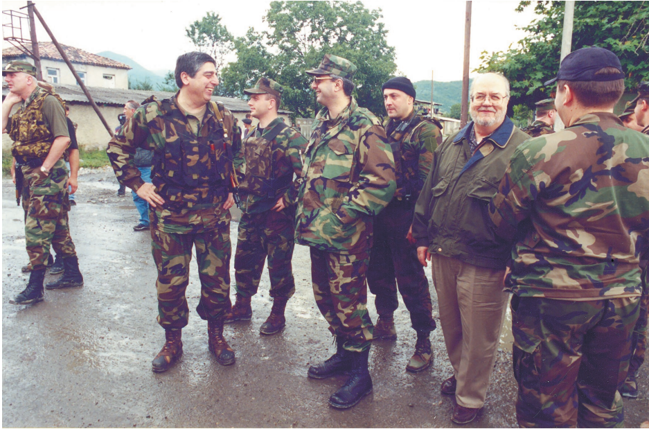
შს მინისტრი კობა ნარჩემაშვილი და აშშ ელჩი საქართველოში რიჩარდ მაილსი პანკისის ხეობაში