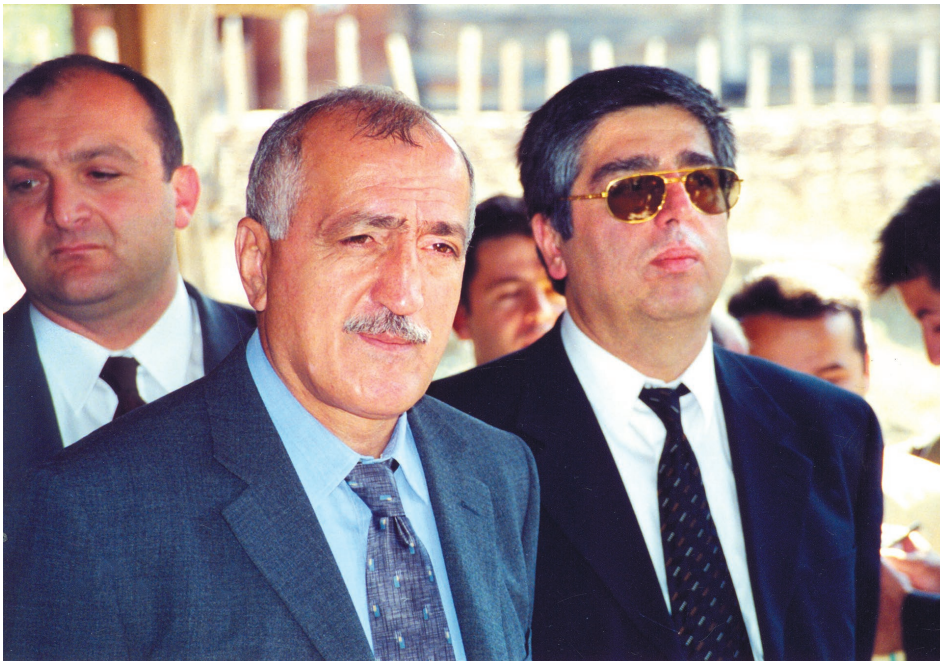
თურქეთის შს მინისტრთან ერთად. 2000