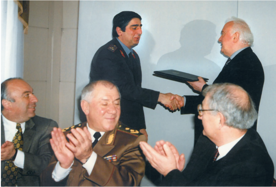
გენერლის წოდების მინიჭების დროს. 1997