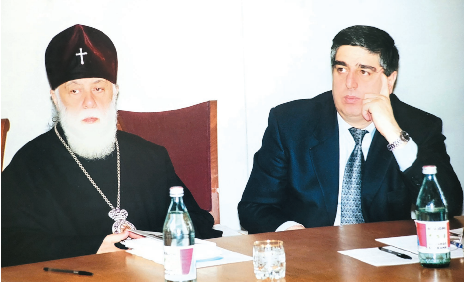
სრულიად საქართველოს კათოლიკოს-პატრიარქთან ილია მეორესთან ერთად.