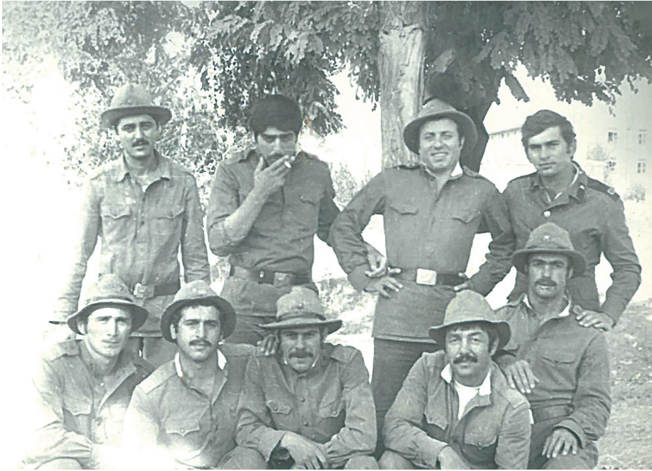
ჯგუფელები საბჭოთა არმიის რიგებში. 1975