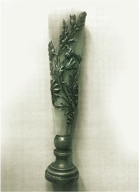
ექვთიმე თაყაიშვილის ფილიგრაფა