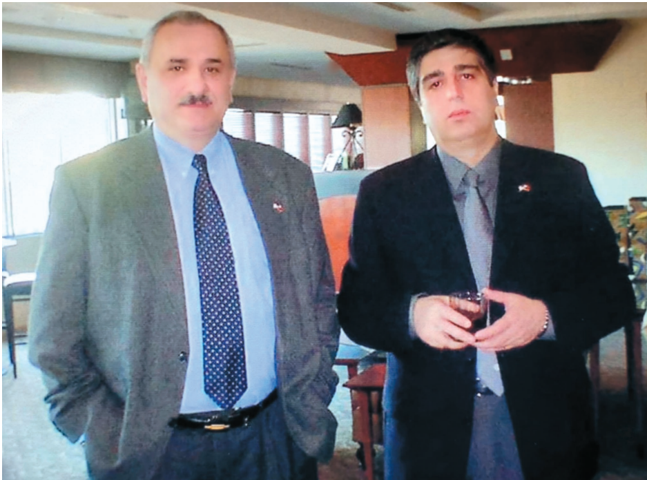
დაზვერვის სამსახურის უფროსთან ავთანდილ იოსელიანთან ერთად აშშ-ში. 2001