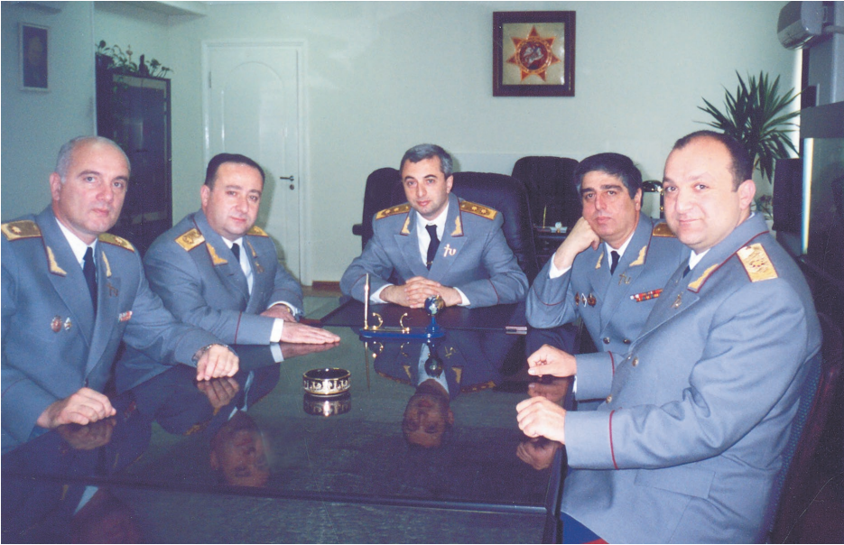
მარცხნიდან: შინაგანი ჯარების სარდალი გენერალ-ლეიტენანტი გიორგი შერვაშიძე, გენერალ-მაიორი შოთა ასათიანი, შს მინისტრი, გენერალ-ლეიტენანტი კობა ნარჩემაშვილი, გენერალ- მაიორები ზურაბ ჩხაიძე და დავით თოდუა