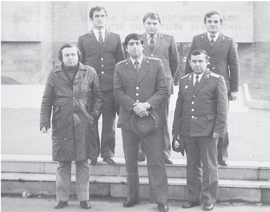
მხარადის მილიციის რაიგანყოფილების თანამშრომლებთან ერთად. 1983