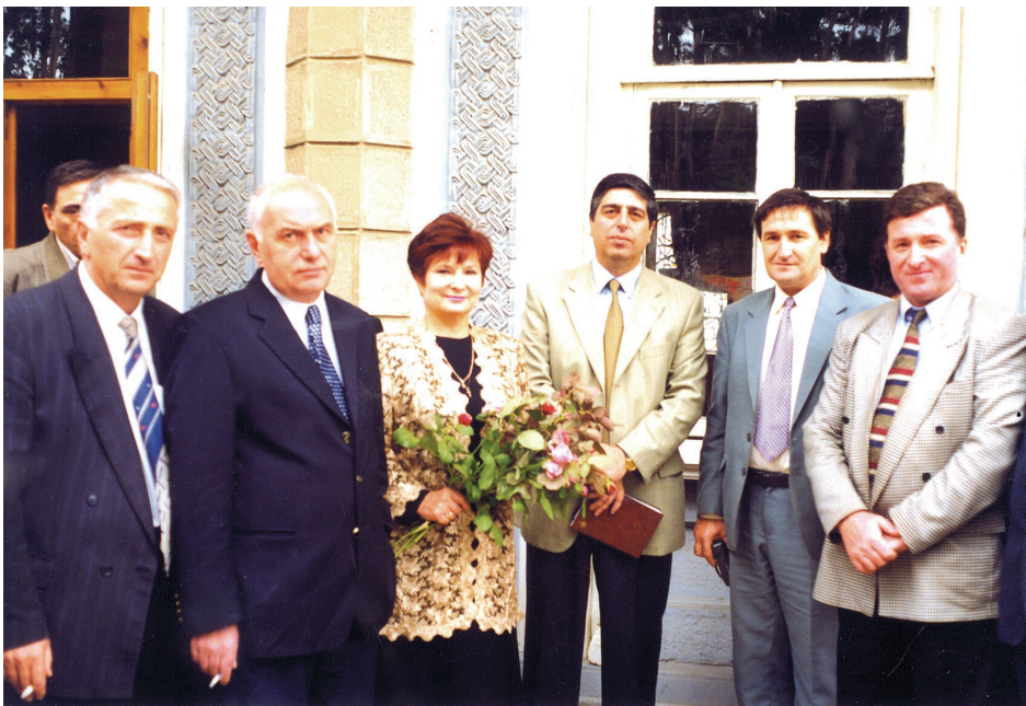
შეხვედრა გენიჩესკელ მეგობრებთან სოფელ შრომაში. 1999