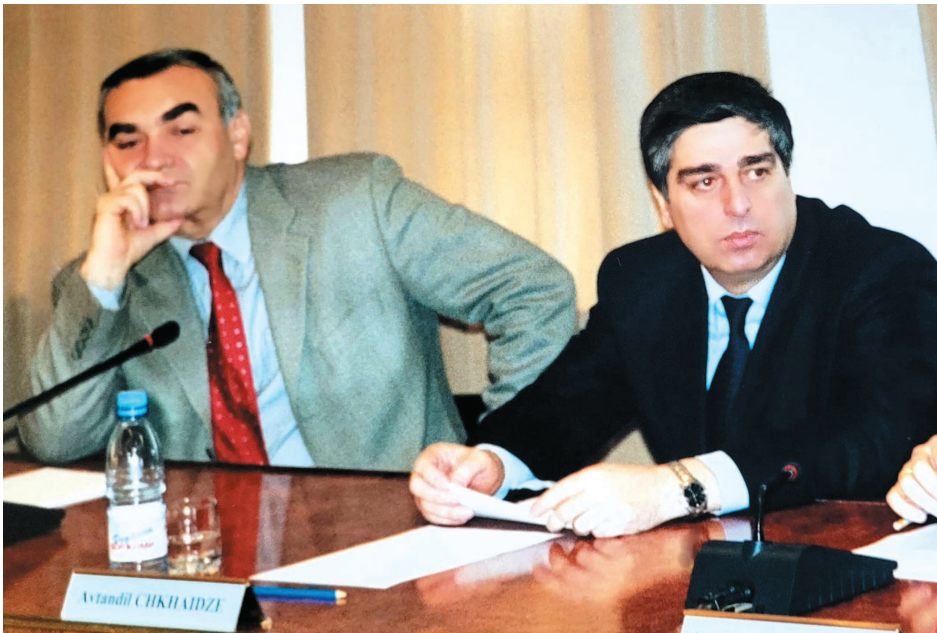
საქართველოს სახელმწიფო მინისტრთან გია არსენიშვილთან ერთად.