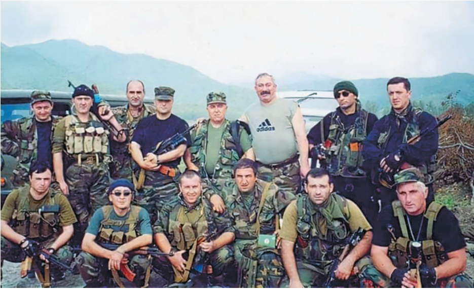
გურიის შს სამმართველოს ხელმძღვანელები და თანამშრომლები პანკისის ხეობაში