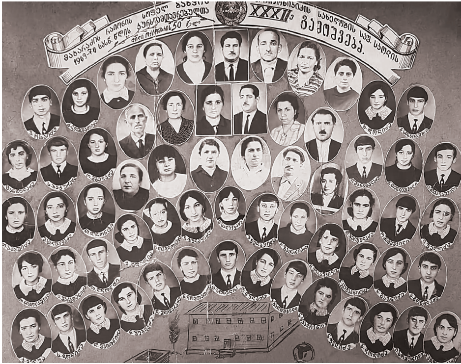
ბაზვის საშუალო სკოლის 1969-70 წწ. გამოშვება