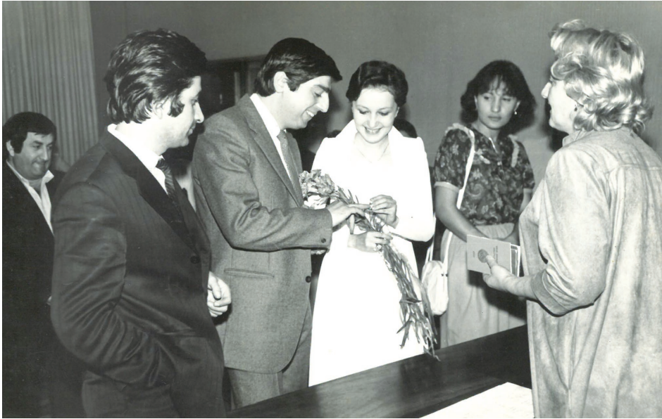
ქორწინების დღე. 1983