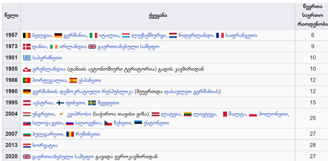
სურ: 2 - ევროკავშირის წევრი სახელმწიფოები

(წარმოადგენს ხალხს), ევროკომისია (ევროკავშირის წევრ სახელმწიფოთა მთავრობებისგან დამოუკიდებელი ორგანო და იცავს საერთო ევროპულ ინტერესებს) და სხვა ევროკავშირის ინსტიტუტები და ორგანოები. მშვიდობა და უსაფრთხოება, ეკონომიკური და სოციალური კეთილდღეობა, წევრი ქვეყნების კულტურული თვითმყოფადობის დაცვა და ღირებულებები – როგორცაა პლურალიზმი, ტოლერანტობა, სამართლიანობა და სოლიდარობა – არის ის იდეა, რაც ევროკავშირში შემავალ 27 სახელმწიფოსა და მის 446 მილიონ მოქალაქეს აერთიანებს. 3