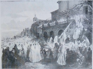
2 ქველი ტფილისი. წყაროები: „დე კავას პეტროსე“, პარიზი, 1847 წ.