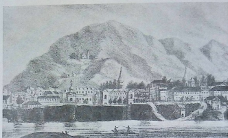
ქველი ტფილისი. შთაწმიდა. ზუბოვის ნახატი. 1833 წ.