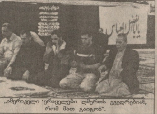
„ამერიკელი ერაყელები ღმერთს ევედრებიან, რომ მათ გაიგონ“.

კიდევ 6000-ის ჩატარება ერაყული წარმოშობის ამერიკელებთან (ანუ შეერთებული შტატების მოქალაქეობამიღებულ ერაყელ ემიგრანტებთან). უარი ჯერ არც ერთსგან არ მიუღიათ. ამერიკაში მყოფ ერაყელებს, THE ECONOMIST-ის სიტყვით, „მოზოგონილი დამოკიდებულება აქვთ“ მიმდინარე ომისადმი. ჰუსეინის ცოტანი თუ უჭერენ მხარს, მაგრამ ძალიან ბევრი, ჰუსეინის მიერ დევნილი და რეპრესირებული შიიტების ჩათვლით, წინააღმდეგენ არიან ამ, მათი აზრით, ზედმეტი ომისა. ისინი წახან თავის იქ დარჩენილ ოჯახებზე და ხედავენ ორმაგ სტანდარტს ამერიკელების მოპყრობაში ერთის მხრივ ერაყისადმი, მეორეს მხრივ, ისრაელისადმი, რომელმაც ანაეროხებულ დაარღვია გაეროს რეზოლუციები.