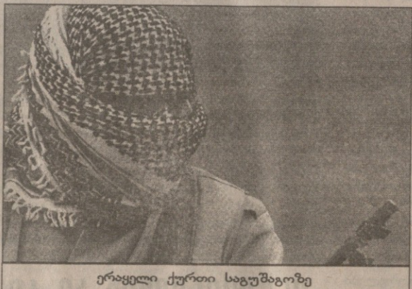
ერაყელი ქურთი საგულშაოზე

აქვთ, — ძირითადად, ნავთობის კონტრაბანდში მონაწილეობის გამო, რომელიც ერაყის ნავთობზე ემბარგოს დადების შედეგად გაჩნდა. ერაყელი ქურთული ძალები სულ ბოლო თვეებამდე გაყოფილი იყო ბარზანის და თალიბანის დაჯგუფებებთან, რომლებიც ისე ძლიერ მტრობდნენ ერთმანეთს, რომ ზოგჯერ მოკავშირედ თურქებსაც და ირანელებსაც კი ინვესტირებდნენ. მიუხედავად