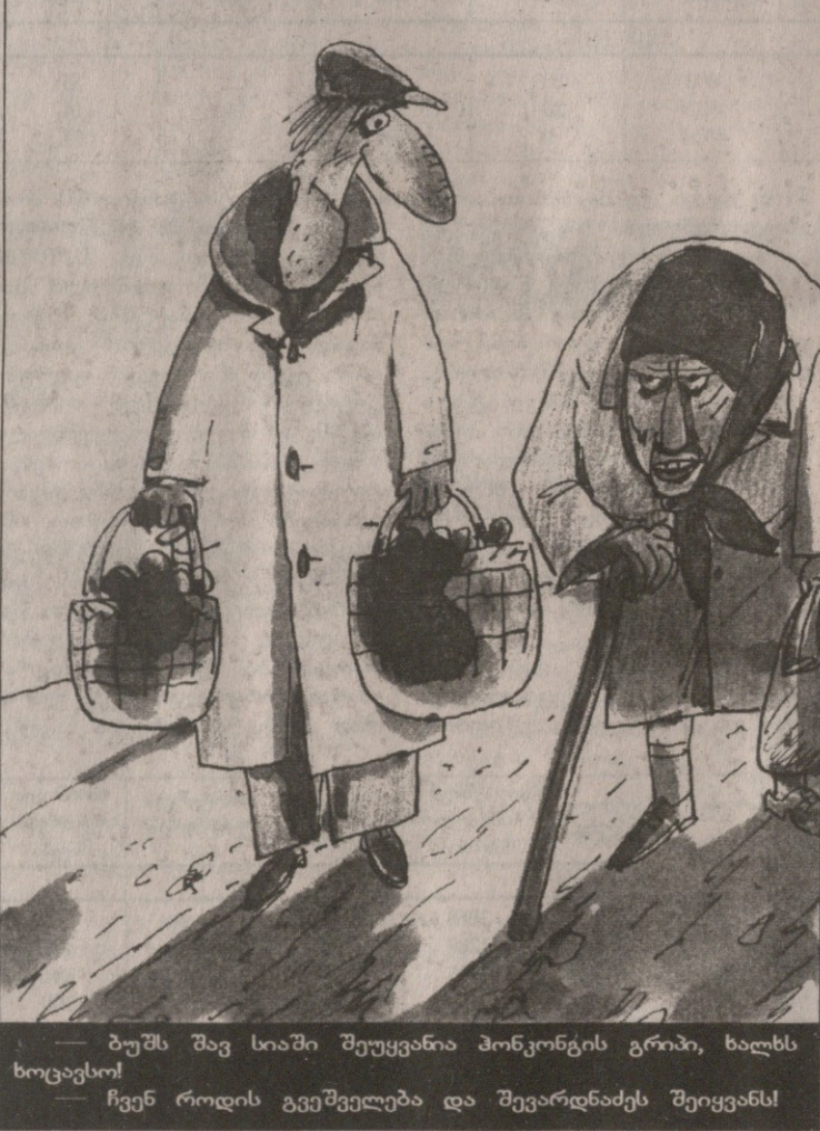
— ბუმს შავ სიაში შეუყვანია პონკონგის გრობი, ხალხს ხოცავსო! — ჩვენ როდის გვეშელება და შევარდნაძეს შეიყვანს!

ვილით ან ცოფით დაინვას, რადგან მას და მის გვერდში მდგომებს, მეცნიერება ფეხებზე ჰკიდიათ. ხალხი, რომლებმაც მილიონები დაიტაცეს (არადა, როცა მილიონებზე საუბრობენ, მე სულ პენცილინი მგონია), რატომ დაინტერესდებიან მეცნიერებით და მის ნიაღში ჭიანჭველებივით მოფუსფუსე, უპრეტენზიო, მათხოვრების დონეზე დასული ადამიანებით?! „მთავარია გქონდეს ფული, რომ არ იყო დაჩაგრული!“ — აი, ის „ლოზუნგი“, რომლის ქვეშაც არიან დარაზმულები დღევანდელი თვითმარქვია „ელიტის“ ანუ მთავრობისა და პარლამენტის წარმომადგენლები. რასაც ჩვენ, ანუ „ბრბო“ ვუყურებდით წინასაარჩევნო პერიოდში, რა ხდებოდა, როგორ დაკა-დაკა და ორომტრალი იყო სკამისმადიებელთა შორის, ადამიანობა შეგზიზღებდა. ისე, რაც მეტად გაუთქვეფენ ერთმანეთს ცხვირ-პირს, მით უფრო მეტს ვიცინებთ შორიდან მაყურებლები. აბა, ის რას ჰგავს? — გამოდის ვიღაცა თავხედი და აცხადებს: „გინდათ თუ არა, მე ამირჩიეთ და მერე მე ვიცი, ქვეყანას ავაყვავებ და ხალხსაც გავაბედნიერებო“. ისე აყვავდეს იმათი ოჯახები, ვინც ასე „ნალკობად“ გვიქვია საქართველო.