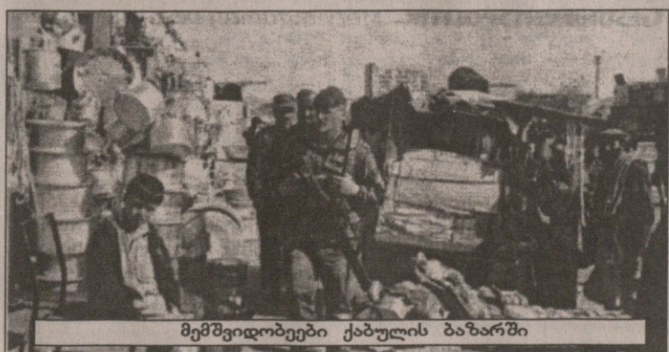
მემშვიდობები ქაბულის ბაზარში

ტრანზანდის შემოსავალი. იზრავლი ზარალობს ტურიზმის უკვეცისაგან და პალესტინაში ვაჭრობის შეკეცისაგან. ამერიკული ფინანსური დახმარების საჭიროება ძლიერი პოლიტიკური ბერკეტია ამ ქვეყნების მთავრობებზე ამ ქვეყნის ზემოქმედებისათვის. ბუშის მიერ კონგრესისთვის 25 მარტს გაგზავნილი წერილი ომის ბიუჯეტის თაობაზე გულისხმობს თითო მილიარდ დოლარს იზრავლისთვის, იორდანისთვის და თურქეთისათვის, 300 მილიონი ეგვიპტისთვის და მომცრო თანხები ომანისა და ჯიბუტისათვის.