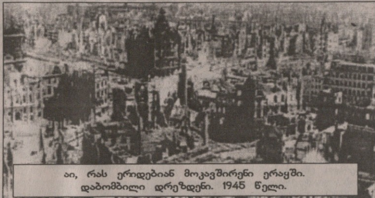
აი, რას ერიდებიან მოკავშირეები ერაყში. დაბომბილი დრეზდენი. 1945 წელი.

სათაურით „ტექნოლოგიის საზღვრები“ ე. „THE ECONOMIST“ აქვეყნებს ანალიტიკურ წერილს იმის შესახებ, თუ რა სახის ბრძოლა მოსალოდნელია ბაღდადში და რა არჩევანთა წინაშე დგას მათი სარდლობა ამ ოპერაციის დაგეგმვის პროცესში. მოკავშირეთა სახმელეთო ძალების წინსვლა ბაღდადისაკენ სწრაფი იყო: შემდეგ იგი შეჩერდა ბაღდადიდან 80 კმ-ის მანძილზე. მაგრამ ეს სწრაფი წინსვლა მოხდა იმის ფასად, რომ მათ ზურგში მოიტოვეს „წინააღმდეგობის ჯიბეები“, ანუ ერაყელთა მნიშვნელოვანი შენაერთები ამა თუ იმ რაიონში. მათი საბრძოლო მომარაგების გზები გაჭიმულია და ამიტომ ზოგან მონყლედილი და დაკავებულ პოზიციებზე უსასრულოდ შეჩერებას არ აპირებენ. ამიტომ გადანაცვლებაც, თუ როგორ უნდა იგდონ ხელი ბაღდადი, მათ მოკლე ხანში უნდა მიიღონ.