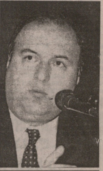
გაგრძელება მე-8 გვ.

უფლებას, ეს გადავკეთო. იმიტომ, რომ ვიღაცა ტამისკრით შეხვდეს ქუჩაში. არ მიჭირდება ის ტამი, თუ მეცოდინება, რომ მე ცუდი ნაბიჯი გადავდგი, არასწორი ნაბიჯი გადავდგი, არა და არასწორი ნაბიჯის გადადგმა არის ის, რომ არ ვითვალისწინებთ იმას, თუ რა ხდება დღეს მსოფლიოში. ჩვენ გვეგონა, რომ „საგა“-ში თუ შევალთ ჩვენ ახლა, ეს იქნება შესვლა სადაც, აი იმ თანამეგობრობაში, რომელიც მერე გზას გაუხსნის საბჭოთა კავშირის რეინოციათა არ არის ეს სწორი, მე მიმაჩნია და ღრმად ვარ დარწმუნებული, რომ სწორედ „საგა“-ში არის ხსნა იმისა, რომ საბჭოთა კავშირის რეინოცია არ მოხდეს. აი, ამ აზრსაც უნდა გათვალისწინებთ, თორემ თქვენ ძალიან კარგად ხედავთ რა ხდება რუსეთში. თუ რუსეთში წავა ის პოლიტიკა და გაიმარჯვებენ რეაქციული ძალები, რომლებიც ძალიან