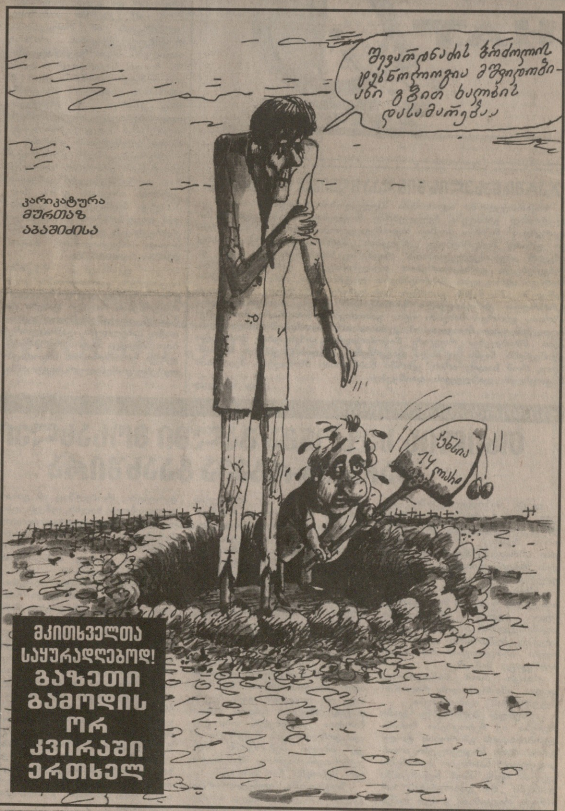
კარიკატურა მურთაზ აბაშიძისა

გკითხველთა საყურადღებოდ! გაზეთი გამოდის ორ კვირაში ერთხელ