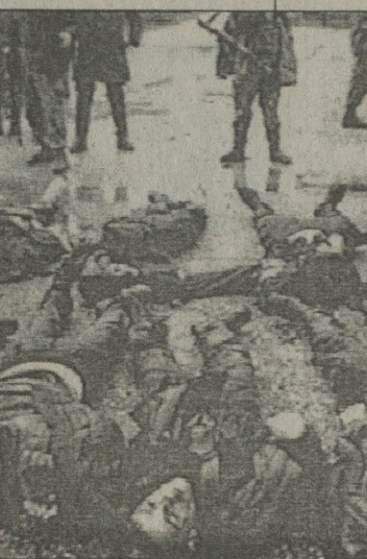
სახველი ვიდუკასეცა ჩართეთ-მეთქი“ — ასეთი იყო ჩემი პასუხი რედაქციისადმი.

ჩემი წერილის საპასუხოდ თქვენ გაგრაში ქართველთა თავებით ნათამბვერი საფეხბურთო მატჩის ამ-