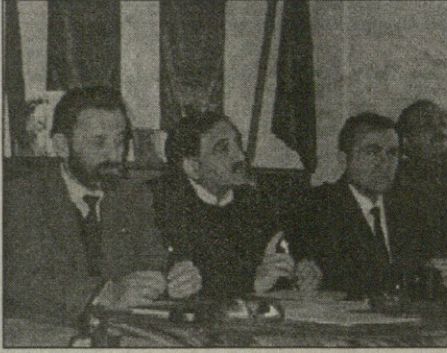
სახელით აშკარად ადასტურებს მათ ალიანსს და მათ უმთავრეს მიზანს. ამჟამად ე. წ. „დიდი შერიგების“ გამოცხადება მხოლოდ და მხოლოდ უკანონობის დაკანონებისათვის სჭირდება, რაც საბოლოო ჯამში ემსახურება მორიგი ფსევდო არჩევნების დანიშნებას. მათ მთელი რიგი მიზეზები დაასახელებს, რომელთა მიხედვითაც, მათი აზრით