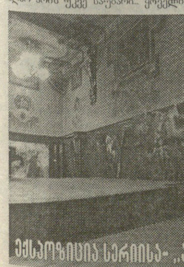
მასპროფიხთა სარჩისა - „აპოლონური ტრაგედიაში“

საქართველოში დღეს ფეხს იდგამს თავისუფალი საგალერო ცხოვრება. რამდენიმე უკვე შეიქმნა კიდევ. ზოგს ზურგს უმაგრებს კომერციული სტრუქტურა, უმეტესობა კი რისკზე მიდის იმდენად, რამდენადაც დამოუკიდებელია. ამავე დროს, არსებობს სხვა ფორმებიც მხატვართა ორგანიზაციისა, ე.წ. მამუალეული ორგანიზაციები. მაგალითად, თავისუფალი მხატვართა ასოციაცია „ვარჯი“, პროფესიონალთა ლოგა და ა.შ. რომლებიც ცდილობენ კავშირები მოძებნონ მხატვარსა და საზოგადოებას შორის, ხელოვანსა და კომერციულ სტრუქტურას შორის.