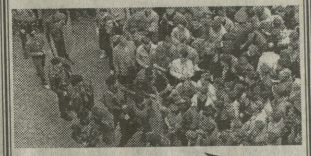
იხ. მეხუთე გვერდი

შპს რამდენიმე წელიწადია, რაც შიდა ქართლის ჩრდილოეთ ნაწილში ჯერ საბჭოთა კავშირის, შემდეგ კი რუსეთის შეიარაღებული ძალების პირდაპირი დახმარებით ოსი ეროვნების სეპარატისტებმა კანონსაწინააღმდეგოდ შექმნეს ოსური ეროვნული ტერიტორიულ-პოლიტიკური ერთეული „სამხრეთ ოსეთის“ სახელწოდებით, დაარქვეს მას „რესპუბლიკა“, ჩაატარეს კანონსაწინააღმდეგო „რეფერენდუმი“ ამ ერთეულის სტატუსის საკითხზე, უკანონოდ აირჩიეს თვითმარქვია „პარლამენტი“ და თვითმარქვია „პრეზიდენტი“. ჯერ საბჭოთა კავშირის, შემდეგ კი რუსეთის შეიარაღებული ძალებისაგან მიღებული იარაღის ძალით მათ გამოაძევეს ქცხინვალის და ყოფ.ზნაურის რაიონის სოფლების ქართველი მოსახლეობა, რომელიც დღესაც ვერ ბრუნდება თავის სახლებში, და, ამგვარად, ჩაატარეს ტერიტორიის, ეთნიკური წმენდა ქართველებისაგან. ოსი ეროვნების მოქალაქეთა ამ უმად მიმდინარე სეპარატისტული გააქტიურება ამ ზონაში სსრკ ცენტრალური ხელისუფლების სტიმულირებით დაიწყო 1987-88 წლებში, როგორც სსრკ ცენტრალური ხელისუფლების პასუხი საქართველოს ეროვნულ-განმათავისუფლებელი მოძრაობის აღმავლობაზე ამ წლებში. 1989 წლის დამლევდნამ ოს სეპარატისტთა ამ გააქტიურებას უკვე მოჰყვა მსხვერპლი, რომელმაც დღეისათვის, ორივე მხრიდან, ათას ადამიანს გადააჭარბა. შიდა ქართლის ჩრდილოეთ ნაწილში „სამხრეთ ოსეთის“ შექმნის მცდელობა რუსეთის იმპერიამ ერთხელ უკვე განახორციელა 1922 წლის აპრილში, რუსეთის არმიის (წითელი არმიის) მიერ საქართველოს დაპყრობიდან 14 თვის თავზე, როცა ოკუპანტთა მიერ „სამხრეთ ოსეთის ავტონომიური ოლქის“ დაარსე-