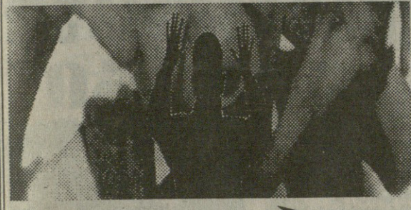
იხ. პენსია გვერდი