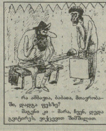
რა ამბავია, ბაბაია, მთავრობა-ში, დადგა ფეხზე? - მაგანი კი - მარა, ჩვენ, დედა გვტრეხს, ვიქვეით შიმშილით.