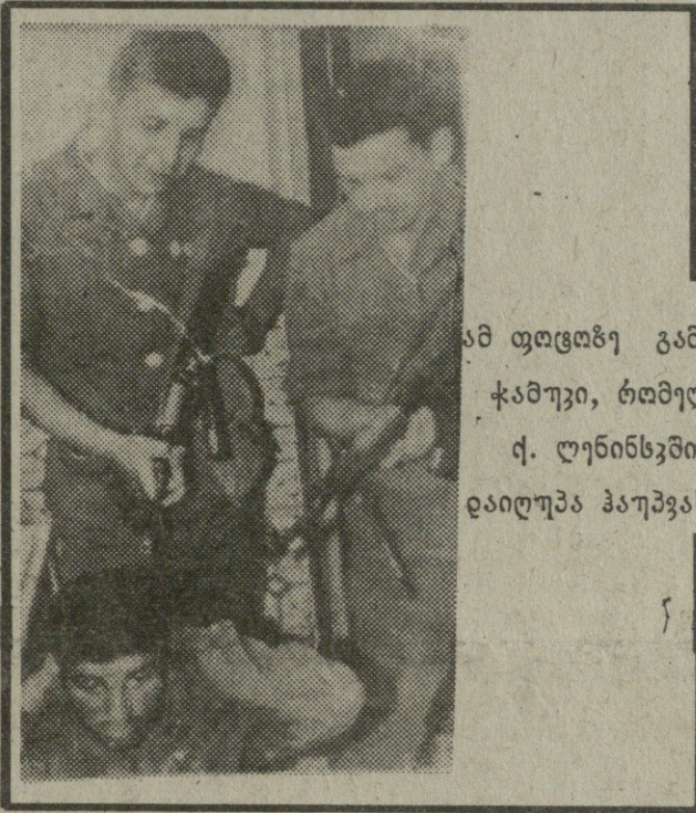
ამ ფოტოზე გამოსახულია ქართული ჯარისკაცი, რომელიც მსახურობდა და ე.წ. ლენინსკში (ყაზახეთის სსრ) დაიღუპა ჰაუბავსტვი ცემის შედეგად.

2. მეორეც, საქართველოში რუსეთის ჯარის ჩაყენებით და მისი დეომა დაკანონებით საქართველო კარგავს პრინციპშივე, ყველა მასშობილური (მეზობელთან) თუ შორეულთან ე.წ. ძალის პოზიციიდან დალაპარაკების შესაძლებლობას, ენაიდან ჩვენს ტერიტორიაზე მდგომარეობა და ჩვენს ძალაზე დიდად აღმატებულ უცხო ძალას ყოველთვის შეეძლება ჩვენი ძალის ნებისმიერი მოქმედების ალკვეთა, აგრეთვე ჩვენი მოწინააღმდეგის ამოწურავი ინფორმირება ჩვენს შესახებ. ეს ეხება თვით იმ ანტიკატორულ (ანტისახელმწიფოებრივ) ჯგუფებსაც კი, რომლებიც ჩვენს ქვეყანაში გაჩნდება სეპარატისტული ან სხვა მიმართულების მეამბოხეთა სახით (რუსეთის ჯარების დამოკიდებულება სეპარატისტებისადმი და სხვა მეამბოხეებისადმი ამ ბოლო წლების მანძილზე არაერთხელ ვნახეთ). ამგვარად, რუსეთთან პარაფორმული ხელშეკრულება საქართველოს ხელისუფლებას პოლიტიკურ პარალიზებას უზღვეს არა მარტო საგარეო ურთიერთობებში (გვარიტყვას რა ნეიტრალური, ან ჯერჯერობით მოუმხრობელი ქვეყნის ხელთ არსებულ თავისუფლებებსა და სხვა უპირატე-