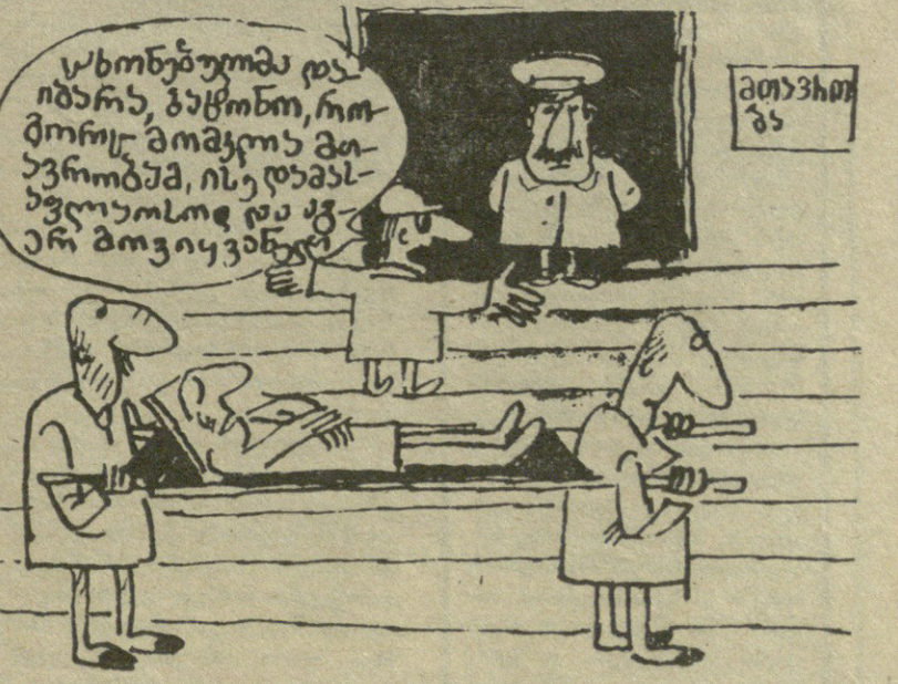
მ. აბაშიძის ნახატი

საპარლამენტო არჩევნებზე და ამგვარად იგი არ გამოხატავს ამომრჩეველთა ნებას. ხსენებულ გარემოებათა გამო, ბატონ ე. შევარდნაძის და მისი პირადი წარმომადგენლების ხელმოწერა საქართველო-რუსეთის ურთიერთობის მარეგულირებელ დოკუმენტებზე სახელდობრ, დაგომისის შეთანხმებებზე, 4 აპრილის და 14 მაისის შეთანხმებებზე, დსთ-ის წესდებასთან საქართველოს შეერთებაზე დეზაფიურებულ უნდა იქნეს, ხოლო დოკუმენტები — ბათილად ცნობილი“.