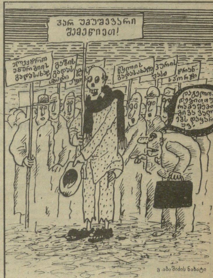
გ. აბაშიძის ნახატი