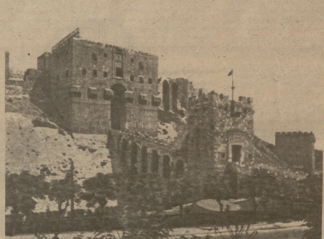
ალექს (ბაღების) ციხე-სიმაგრე. ამ ციხის დიღვეში გაატარა უკანასკნელი დღეები გიორგი სააკაძე.

— რა ნახეთ მანდ ამისთანა?! ენახეთ, ალბათ... უზო ქარაგანის მეტაფორა ხელშეახებად წარმოსახავს სააკაძისა და მისი რაზმის ბედისწერას, რაც ტრაგიკულ აღსასრულს რომც არ გადაეჭრა, ისედაც შერე და გაუსაძლისი გასაძარცვო. ამ ბედისწერას გადაეწევა ამ სიმორზე და უზოუკვლოდ დააქანებდა.