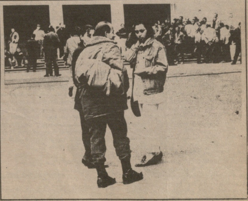
მოხალისენი ომში მიდიან...