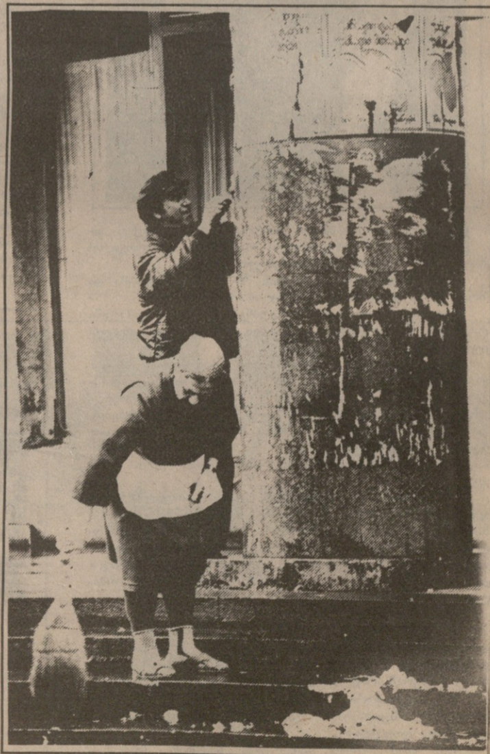
არჩევნები დამთავრდა. ამუშავდა ცოცხი.

დაჭამთ ერთმანეთს, დადებთნიშნის კანდიდატებისთვის ფასიან, კომერციულ პარლამენტს გავსსით.