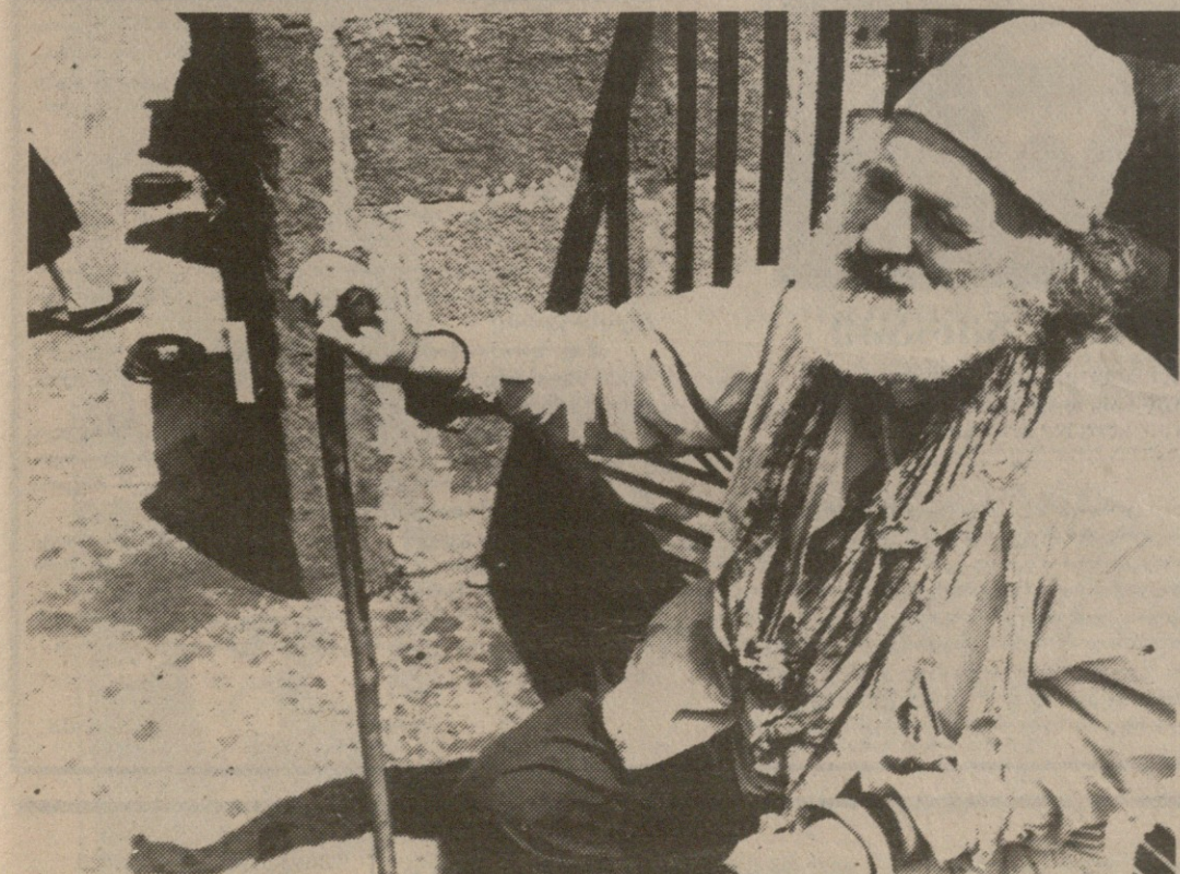
ნორჩრში წარმოდგენილი ცოტოების ავტორია ჯემალ ასრამბე