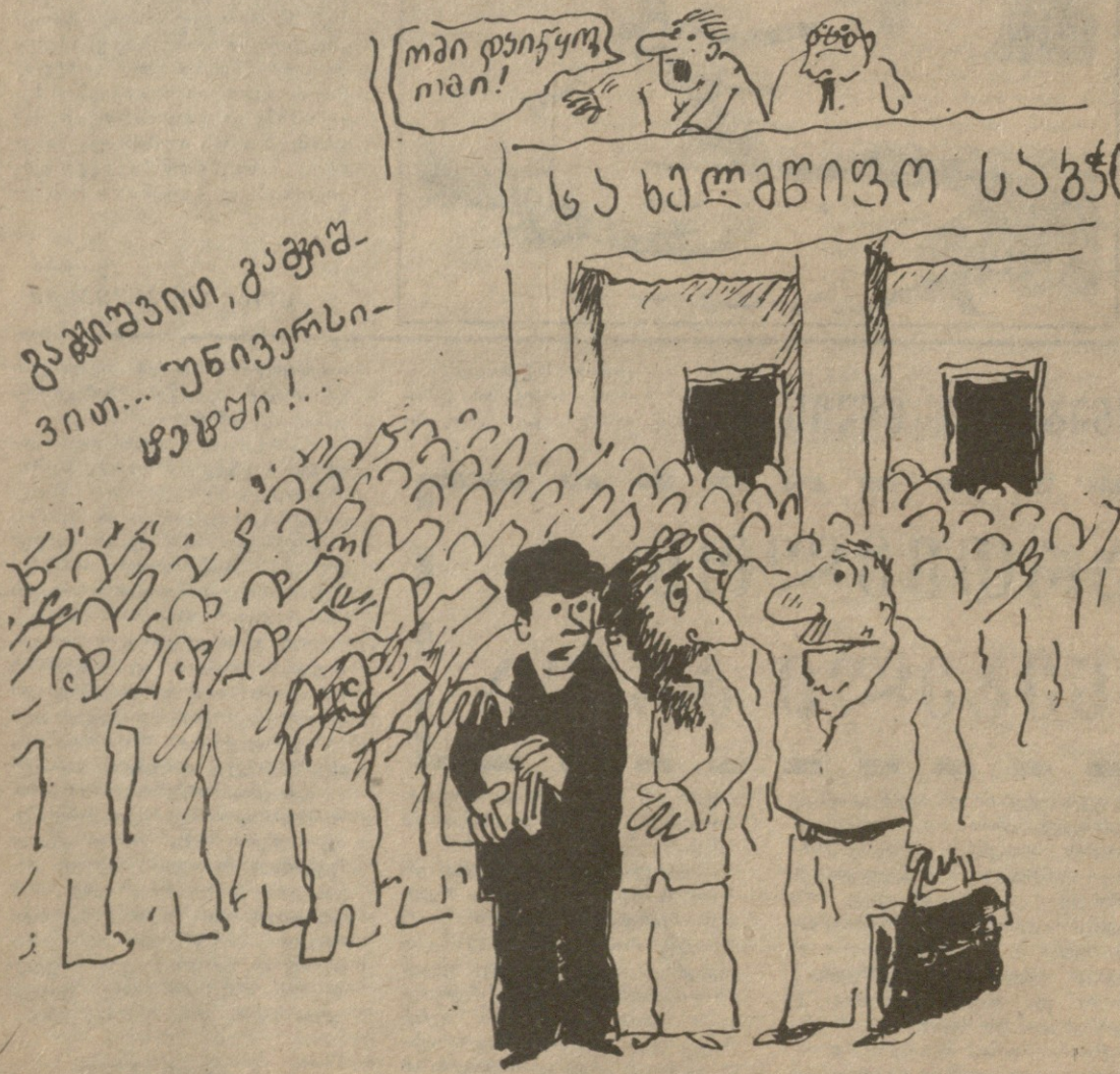
ნომერიში წარმოდგენილი ნახატების ავტორია მშრტის აბაშიძე