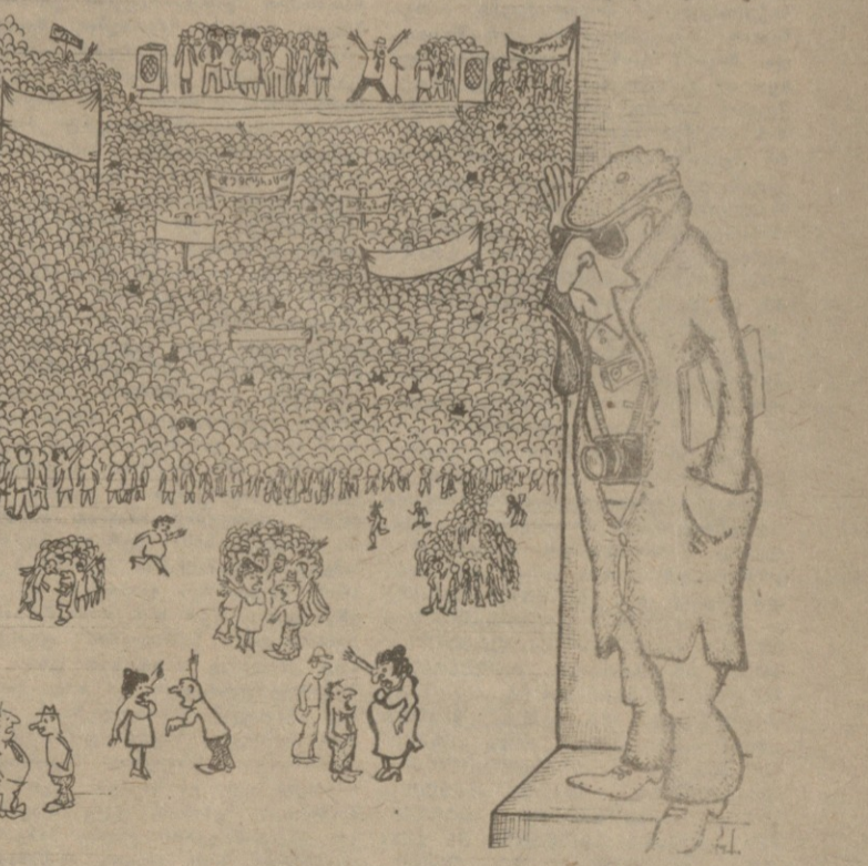
ეს საიდუმლო მასალა მოიპოვა მიხომ მოსულიყვილმა.