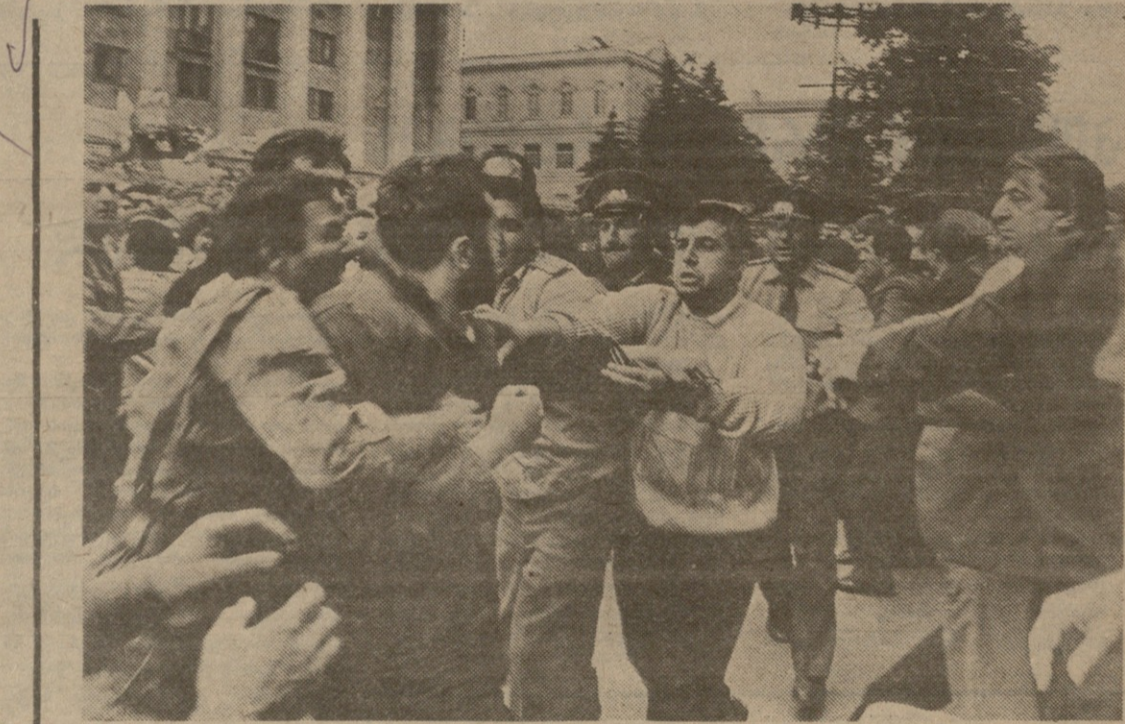
პაი, ჩვენო ქართველის ბედო..

ძირს დაიტატურა!!! გამოფხიზლდით... გამოფხიზლდით, მძებო ზუგდიდელბო, კუთხისლებო, გურჯაანელბო, ხაზურლებო, ხობელებო, მესტიელებო... ერთიანი საქართველო!