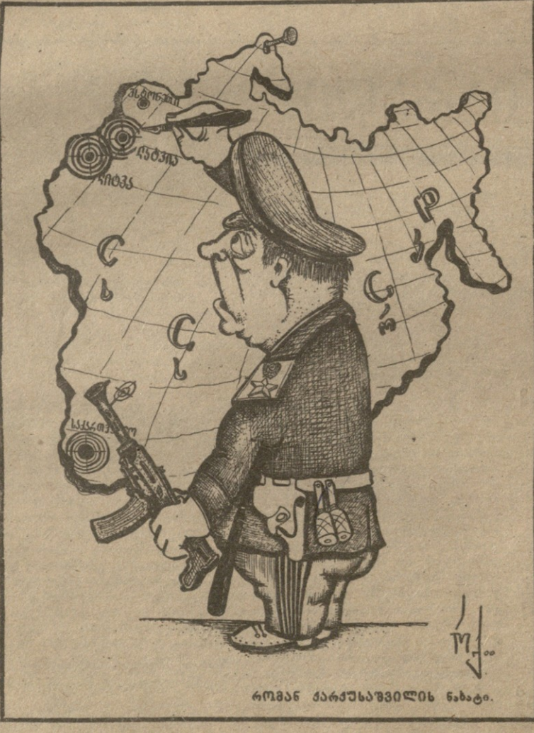
რომან მარტოშვილის ნახატი.

შელოდ თქვენ, ქართველებს. და- გავალებთ შემდეგს: თუ თქვენ ჩვენ არ გვეშველით, მაშინ ის ძივეც ქე- ნით, რომ რუსებთან ერთათ თქვენის ნებით არ შემოყვებით, ბრძოლა არ დაგვიწყეთ, თქვენ თქვენთვის იყა- ვით, სურც ჩვენ გვეშველით და სურც რუსებს მივბრძობით. ამას გარდა გავალებთ კიდევ შემდეგს ოსმალეთიდან ჩვენ საომარ იარაღს ვლოთ, ახალციხის გზით იქნება თქვენი ქვეყნისაკენ გამართარის იარაღი ჩვენმა კაცებმა და თუ შე- საძლებელი იქნება და რუსთაგან თქვენ არაფერი გვენებათ, მაშინ ამ იარაღის გამტარებლებს მფარველო- ცა გაუწყობთ, მაშინ შორს ამისაგან არ წაართინ. თუ ეს დავალება თქვენ- თვის მძიმე იქნეს და რუსების შე- გეშინდეთ, მაშინ შორს ამისაგან, რუ- თაფერს საქმეში ნუ ჩაერევთ. თქვე- ნი იმედი გვაქვს, რომ საქართვე- ლოში ჩვენს მომხრეობას გაავრცე- ლებთ. სხვაც ბევრი რამ ყოფილა შამი- ლისგან ქართველებთან მოწერილი, ჩვენ ეს ვიკითხეთ, ეხვეც საქარ- მის საფუძველათ, რომ ვიცოთ, ის გარემოება, რომ გმირ შამილთან ქართველებსაც ჰქონიათ კავშირი და მისი გმირობა ქართველთაგანაც ყო- ფილა დღვარული და დაცული. ვე- მცა ხშირათ ისიც უნდა, რომ რუ- სების დავალებით და იძულებით ქა- რთველნიც ეგრძობდნენ ლეკებს და შამილს.