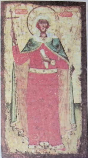
წმინდა ნინო. მერვიდმეტე საუკუნის ხატი.