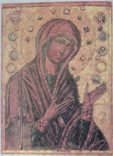
ღვთისმშობლის ხატი მეთე საუკუნისა.