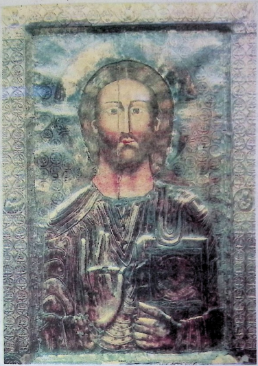
იესო ქრისტეს ჭეღური ხატი მეთუ საუკუნისა.