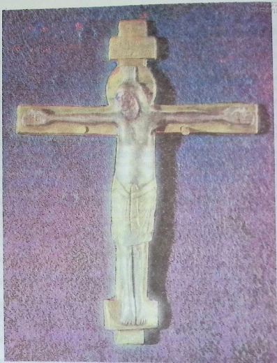
იშხანის საწინამძღვრო ჯვარი მეათე საუკუნისა.