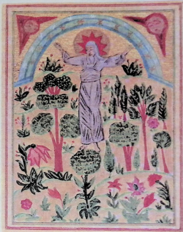
სამყაროს შექმნა. მეჩვიდმეტე საუკუნის ქართული ხელნაწერის ილუსტრაცია