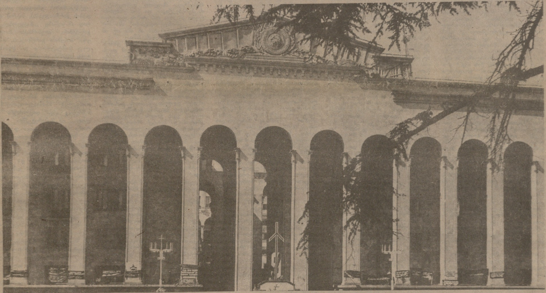
სხვა ხალხის ისმის ან შრიამული...

საქართველოს სახალხო ფრონტი ულოცავს ქართველ ერს ძრავალპარტიულ არჩევნებში ობოზიციის გამარჯვებას!