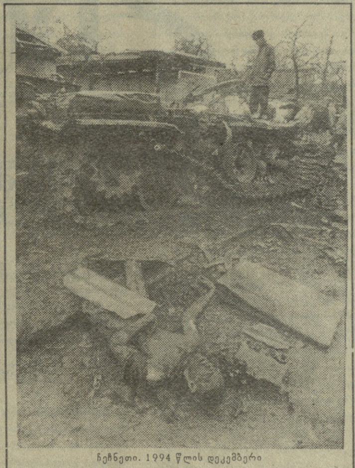
ჩენეთი. 1994 წლის დეკემბერი

დმი რუსეთის ტერიტორიიდან დაბრუნების გამო რუსეთის ხელისუფლებისადმი ჩვენი ხელისუფლების მხრიდან საპროტესტო გამოსვლას, რუსეთის საგარეო საქმეთა სამინისტროს საბასუბო წერილი მოპყვა, რომელშიც ხაზგასმული იყო შემდეგი თავის მართლება, რომ აღნიშნულ დაქტებს შესაძლოა ადგილი აქვს, მაგრამ ეს ჩვენი ხელ შეწყობით