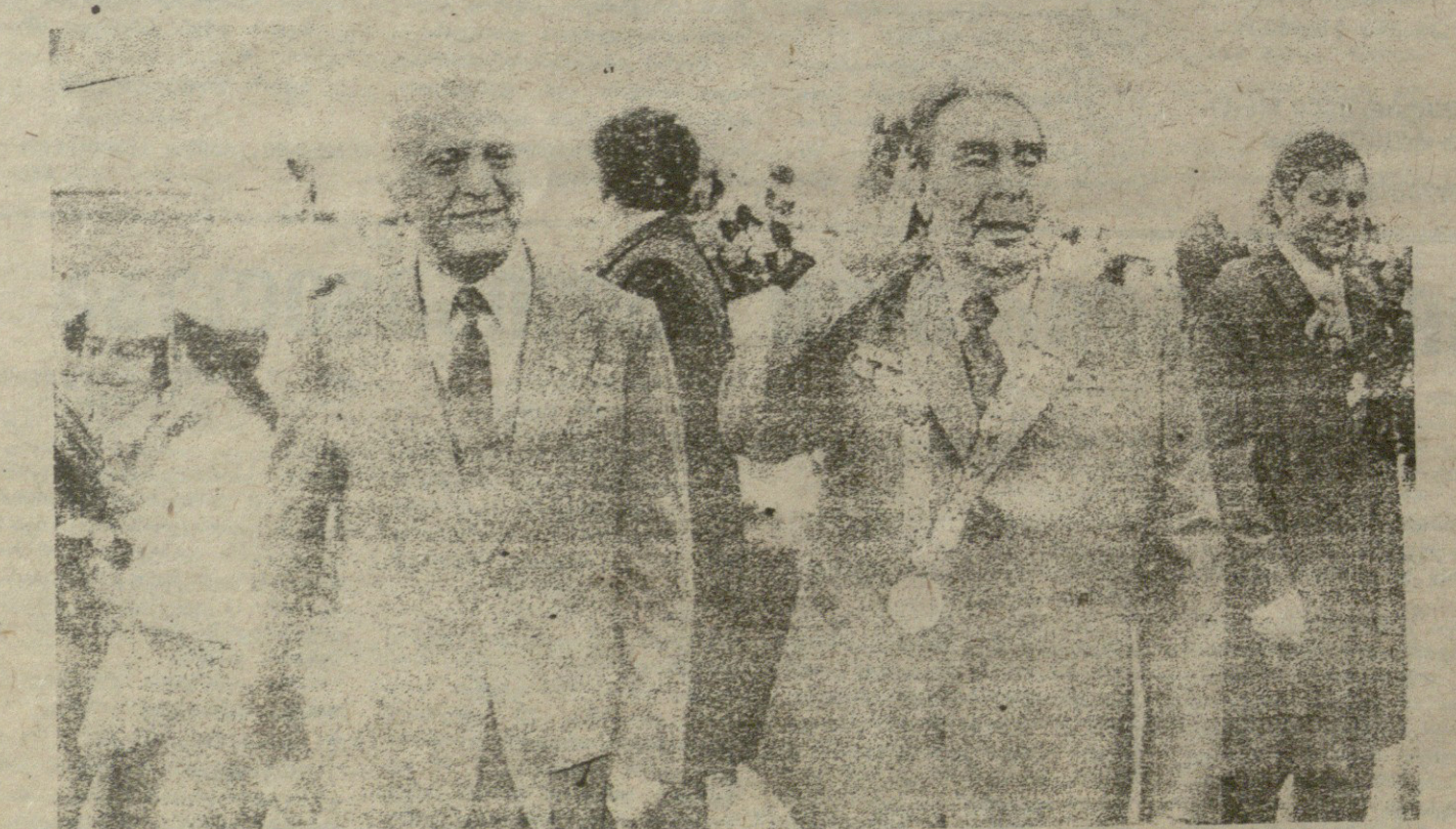
„დღეს, როცა თავის მე-60 წლისთავს ზეიმობს, საბჭოთა საქართველოს თითქოს თვალწინ უცოცხლდება თავისი ისტორია, იგი კიდევ და კიდევ ავლენს გონების თვალს 1921 წლის დაუვიწყარი თებერვლის დღეებიდან, იმ დღეებიდან გამოვლილ გზას, როცა საბჭოთა რუსეთი, უცხოეთის ინტერვენციით თავად დაუძღვრებულნი, სამოქალაქო ომით გაჩინაგებული, გამოეხმებურა საქართველოს აჯანყებულ მუშათა და გლეხთა თხოვნას და მოძმე ხალხს დასახმარებლად მოუვლინა გმირული მე-11 წითელი არმია.“

(საზეიმო სხდომაზე წარმოთქმული სიტყვიდან).