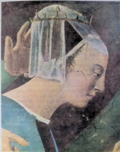
საბას დედოფალი. მეთხუთმეტე საუკუნის იტალიელი ფერმწერის პიერო დელა ფრანჩესკას ნახატი.