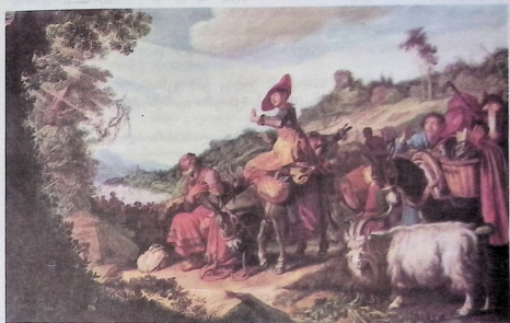
აბრაამი ქანაანისკენ მგზავრობისას. მეჩვიდმეტე საუკუნის პოლანდიელი მხატვრის პიტერ ლასტმანის ნახატი.