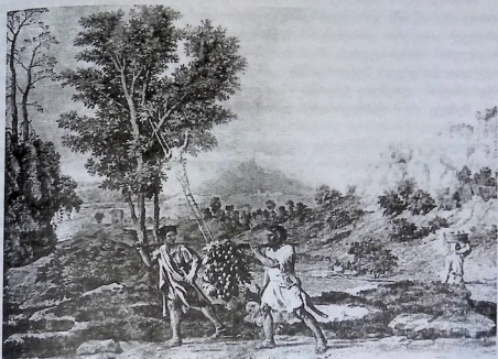
აღთქმული ქვეყნის მზვერავნი. მერვიდმეტე საუკუნის ფრანგი მხატვრის ნიკოლა პუსენის ნახატი.