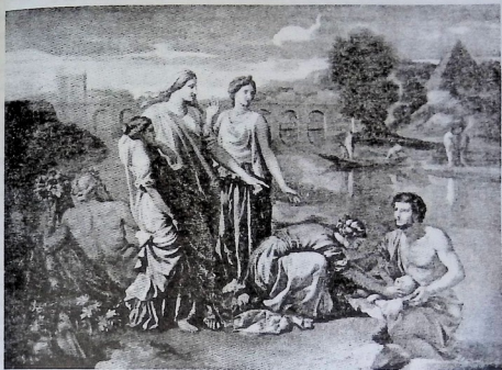
მოსეს პოვნა ფარაონის ასულის მიერ. მერვიდშეტე საუკუნის ფრანგი მხატვრის ნიკოლა პუსენის ნახატი.