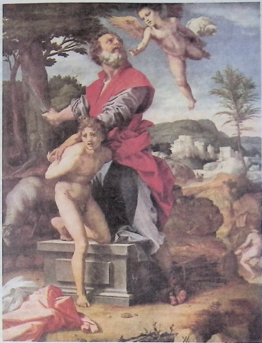
აბრაამის მსხვერპლი. მეთეჟესმეტე საუკუნის იტალიელი მხატვრის ანდრეა დელ სარტოს ნახატი.