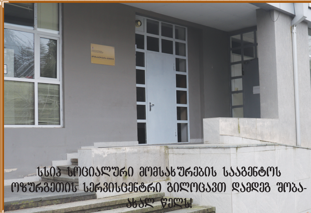
სსიპ სოციალური მომსახურების სააგენტოს ოფიციალური სერვისცენტრი ბილოცავთ დამდეგ შობა-ახალ წელს!