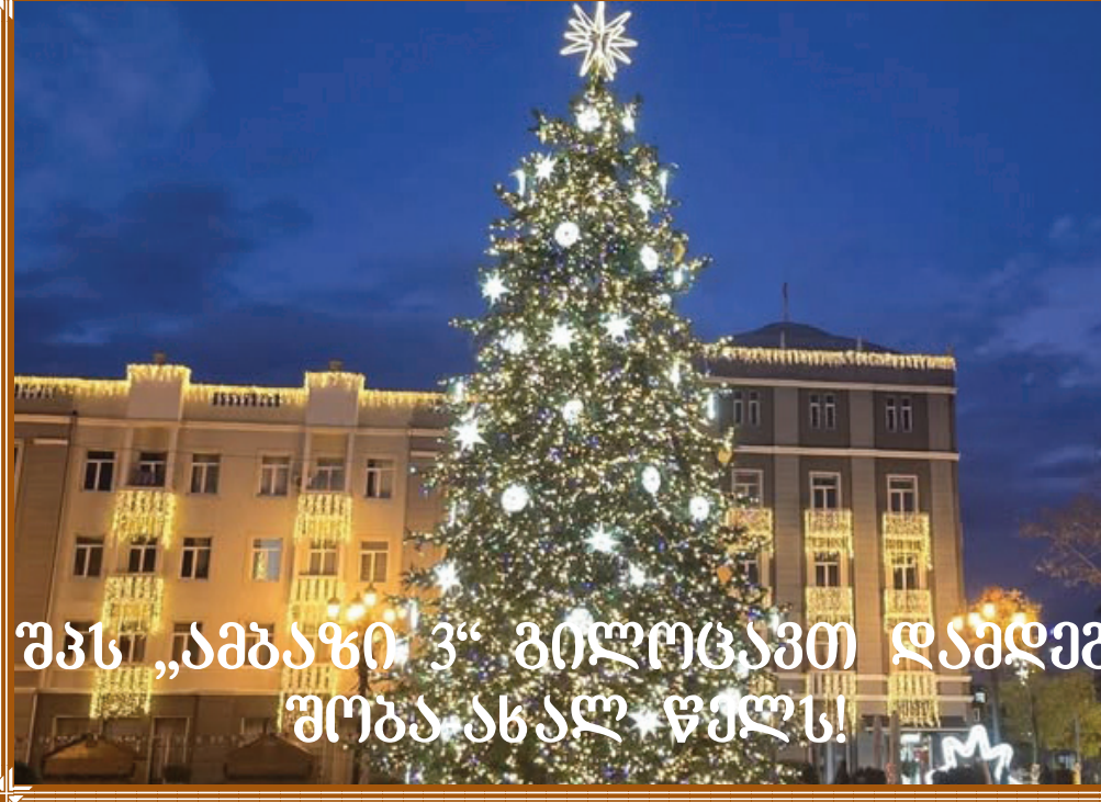
შპს „ამბაჯი 3“ ბილოცავთ დამდეგ შობა-ახალ წელს!

საღამოს საზეიმოდ აინთო მთავარი ნაძვის ხე, ჩატარდა ადგილობრივი შემსრულებლებისა და დედაქალაქიდან მოწვეული მომღერლების კონცერტი.