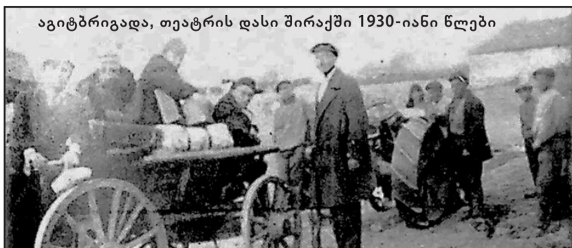
აგიტბრიგადა, თეატრის დასი შირაქში 1930-იანი წლები

საგასტროლო სპექტაკლები იმართებოდა საქნავთის მუშათა კლუბის კეთილმოწყობილ სცენაზე. საქნავთის ტრესტის