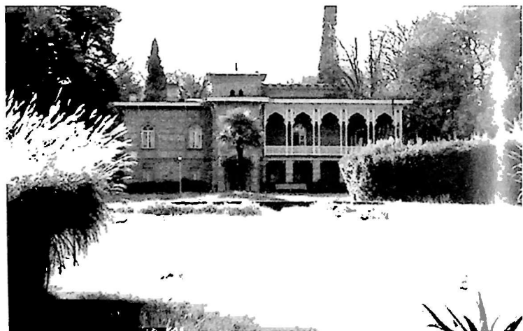
საგურამო, ი. ჭავჭავაძის სახლ-მუზეუმი