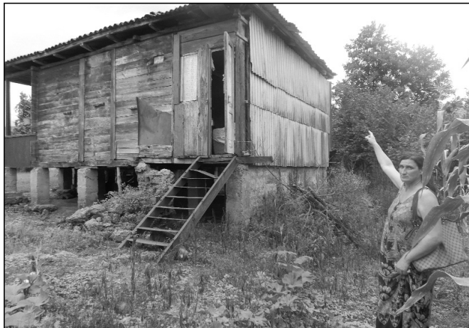
მყოფი ოჯახია. თავად ხედავთ, სახლს საძირკველი რა მდგომარეობაში აქვს. საჭიროა სხვა დახმარება.