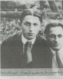
მარცხნივ — რამდენიმე ვაგებით, მთვინე ვაგებით, მთვინე ვაგებით.