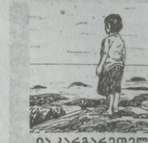
ია პარბარბიძე 83.8-9