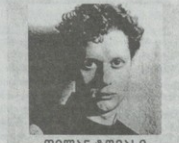
დიღან ტოვაში 83.15