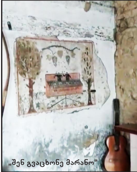
„შენ გვაცხონე მარანო“

სახლებს არემონტებენ. ამჟამინდელი პატრონი იმავე უბანში, სხვა სახლში ცხოვრობს, ამ სახლს კი პერიოდულად მდგომარეობაზე აქირავებს ხოლმე. „შირაქმა“ თემაზე მუშაობისას ისეთ ადამიანებსაც მიაგნო, რომელთაც ამ სახლის ისტორიაც კარგად იციან და მრავალწლიანი კონტაქტი აკავშირებთ. მათგან ბევრი საინტერესო დეტალი შევიტყვეთ.