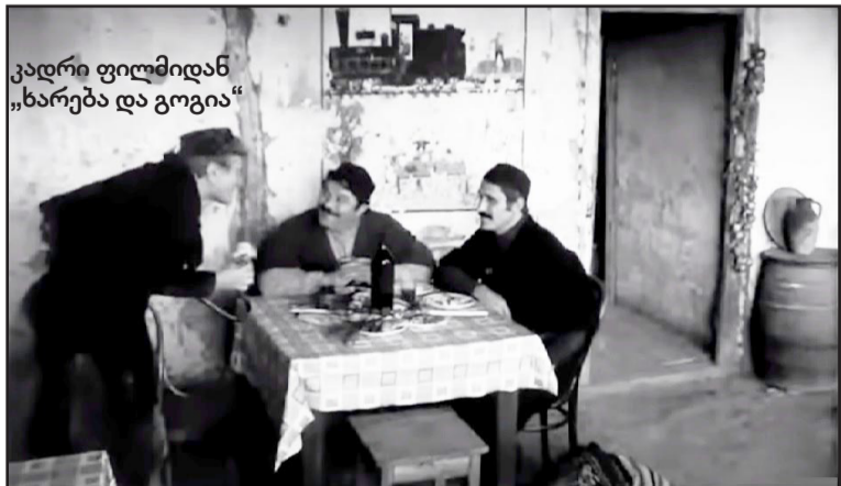
კადრი ფილმიდან „ხარება და გოგია“

ჩამოვხსენით და ქვეშ, მეორე კედელზე კიდევ ერთი ნახატი გამოჩნდა. ერთი ნახატია „შავი ორთქლმავალი“, მეორე „შენ გვაცხონე, მარანო“. საოცარი კომპოზიციაა, ფიროსმანის თვალთ დახატული. დეტალებში მიაქციეთ ყურადღება, დააკვირდით მტკვრებს, ქვევრების განლაგებას, ჯვრებს. საოცარია ეს ყველაფერი, ბევრი რამაა ჩადებული. ამ ადგილიდან ჩანდა ქერემის ხევის რკინიგზა. ალბათ ნიკალა მატარებლით ჩავიდა ველისციხეში და ამიტომ დახატა. მხოლოდ ჩემი აზრი არ არის, რომ ეს ნამდვილად ნიკალას ნახატებია. ბევრმა წონიანმა სპეციალისტმა დაადასტურა ეს — ამირან გოგლიძემ, გუჯეჯიანმა და სხვებმა. ლიად თქვეს სპეციალისტებმა, რომ ეს ნამდვილად ნიკალა იყო. შემდეგ გასულფთავდა ეს მიტოვებული ადგილი, რესტავრაციაც ჩატარდა. მერე 90-იანი წლების არეულობა დაიწყო და განუკითხაობა და აღარავის გახსენებია. შენობა კიდევ რამდენჯერმე გაიყვინდა. სხვათაშორის, მსოფლიოში ცნობილ მხატვარსა და მოქანდაკეს ზურაბ ნერეთელს სურდა ამ სახლის შექმნა, მაგრამ ხელისუფლებაში ნაციონალური მოძრაობა მოვიდა და აღარ მოხერხდა. მეც ბევრს ვცდილობდი, რომ დაცული ყოფილიყო ეს ადგილი და წლების მანძილზე გამოსავალს ვეძებდი. 2004