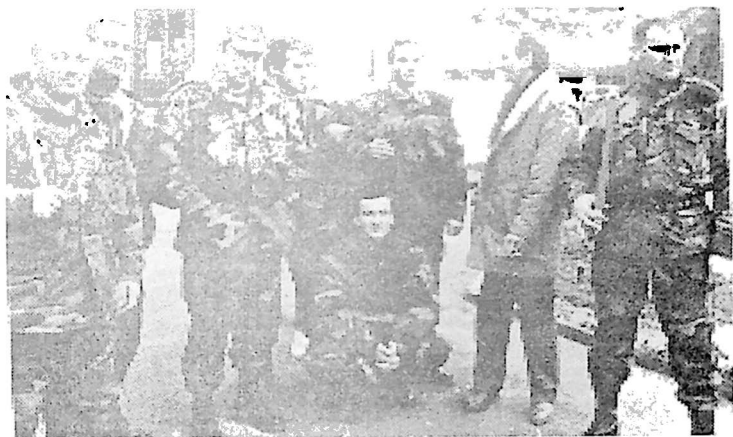
6. გენერალ-მაიორი თამაზ ნადარეიშვილი თანამებრძოლებთან. სოხუმი, 1993 წელი.