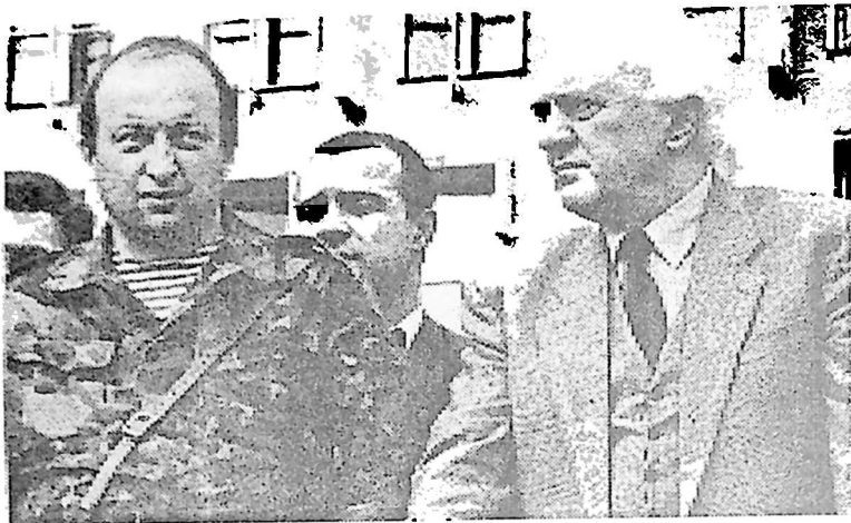
7. სახელმწიფოს მეთაური ბატონი ედუარდ შევარდნაძე სოხუმში. 1993 წლის ოქტომბერი.