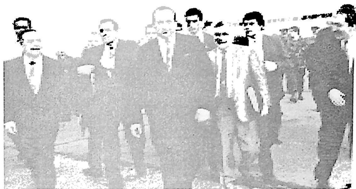
5. რუსეთის ფედერაციის საგარეო საქმეთა მინისტრი ანდრია კოზირევი, მინისტრის მოადგილე ბორის პასტუხოვი, უშიშროების მინისტრი ბარანიკოვი. სოხუმი, 1993 წ.