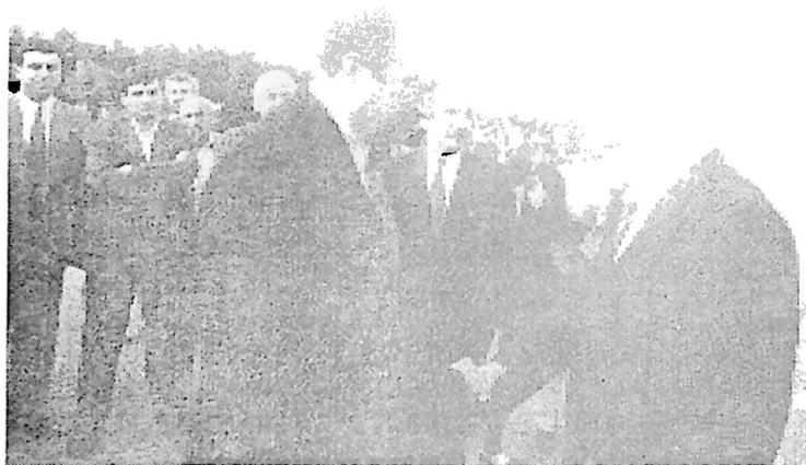
4. რუსეთის ფედერაციის საგარეო საქმეთა მინისტრი ანდრია კოზირევი და აფხაზეთის მინისტრთა საბჭოს თავმჯდომარე თამაზ ნადარეიშვილი. სოხუმი, 1993 წელი.