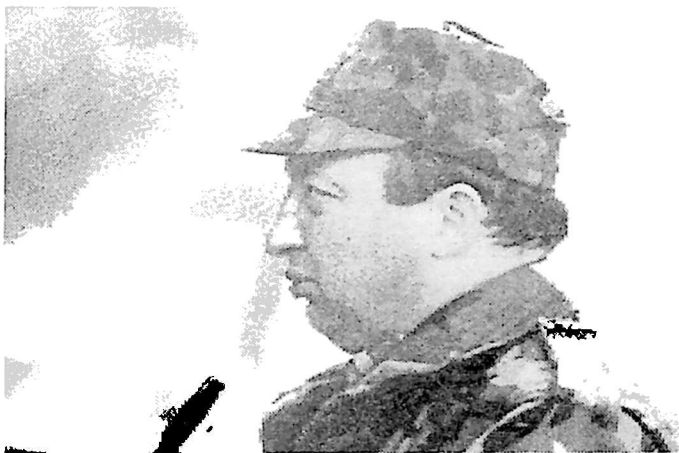
2. 15-16 მარტის სოხუმზე შემოტევის შემდეგ. სოხუმი, 1993 წელი.