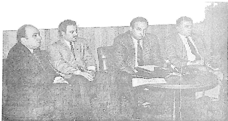
12. პრესკონფერენციაზე მოსკოვში. 1995 წელი.