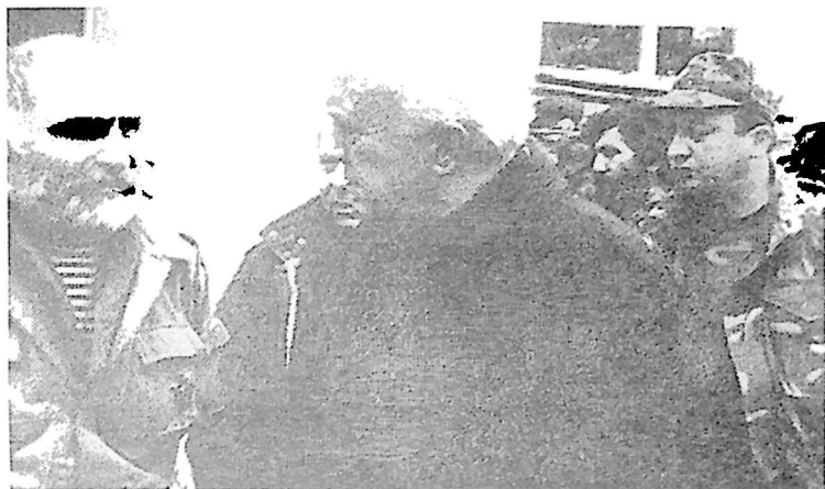
9. სახელმწიფოს მეთაური, შეიარაღებული ძალების მთავარსარდალი ბატონი ედუარდ შევარდნაძე გულრიფში დისლოცირებულ ბატალიონში. სოხუმი, 1993 წელი.