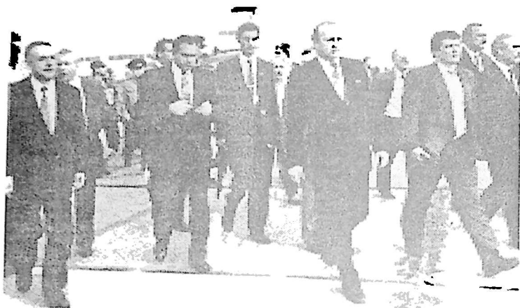
3. რუსეთის ფედერაციის საგარეო საქმეთა მინისტრი ანდრია კოზირევი სოხუმში. 1993 წელი.