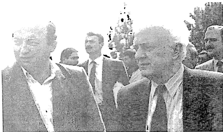
10. ბატონი ედუარდ შევარდნაძე სოხუმში, 1992 წელი.