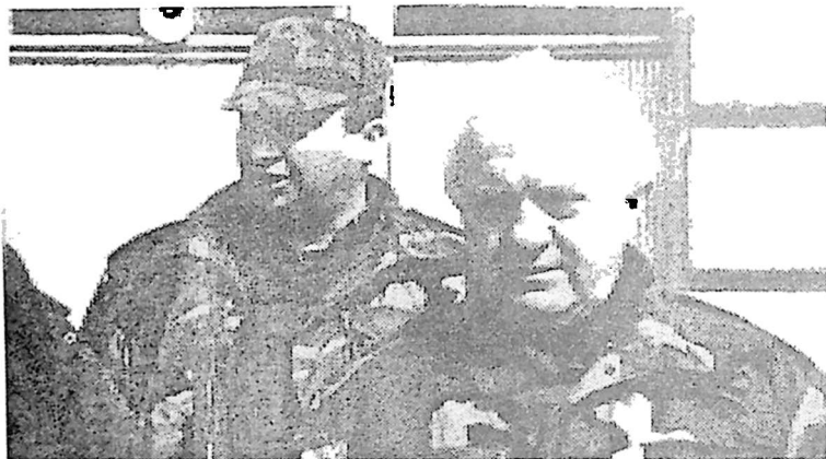
8. სახელმწიფოს მეთაური, შეიარაღებული ძალების მთავარსარდალი ბატონი ედუარდ შევარდნაძე და აფხაზეთის მინისტრთა საბჭოს თავმჯდომარე, აფხაზეთის თავდაცვის საბჭოს თავმჯდომარე ბატონი თამაზ ნადარეიშვილი. სოხუმი, 1993 წელი.