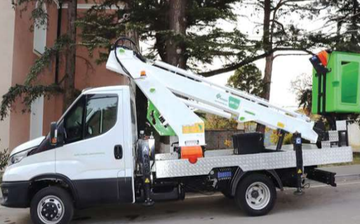
ენელოვნად შეუწყობს ხელს ა(ა)იპ "კასპის კეთილმოწყობის" გადამართულ მუშაობას და შესაბამისად მოსახლეობის მომსახურების ხარისხის გაუმჯობესებას.

მუნიციპალიტეტის მერიამ ახალი ტექნიკა - ამწე კალათი შეიძინა. ტექნიკა ა(ა)იპ "კასპის კეთილმოწყობის" გადამართულ მუშაობას და შესაბამისად მოსახლეობის მომსახურების ხარისხის გაუმჯობესებას.