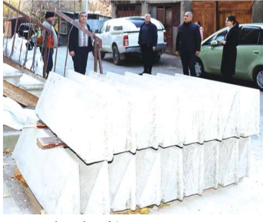
ქალაქ კასპში თავისუფლების ქუჩა №1 - ში ბინათმესაკუთრეთა ამხანაგობის ხელშეწყობის მუნიციპალური პროგრამის ფარგლებში 4 სადარბაზოს რე-

აბილიტაციისა და წყალარინების სისტემის შეცვლის სამუშაო მიმდინარეობს.