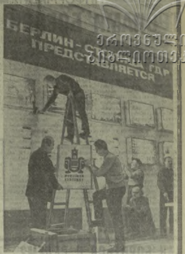
На снимке: в помещении Государственной картинной галереи Грузии готовится выставка произведений искусства ГДР.

Вот, к примеру, книга о Рихарде Штраусе, которого Стефан Цвейг называл «последним из великого рода полнокровных немецких музыкантов основанного Генделем, продолженного Бетховеном и Брамсом».