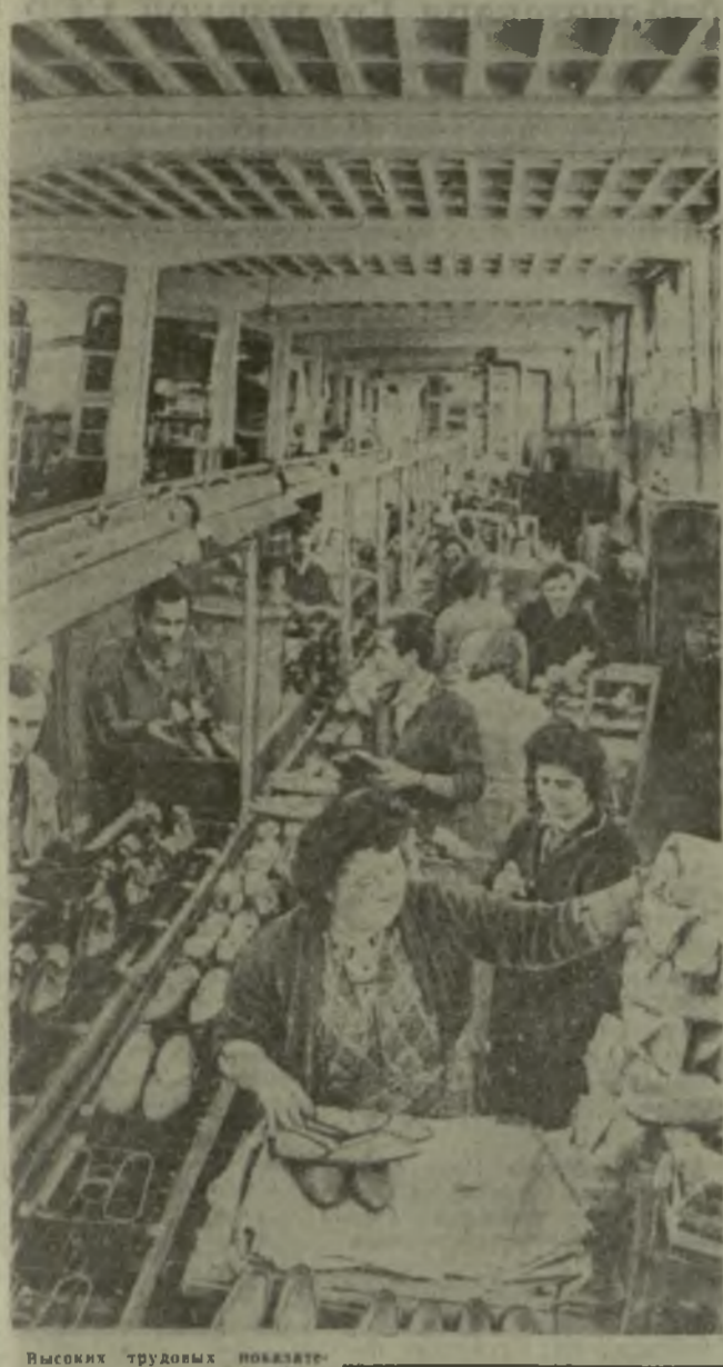
Высоких трудовых показателей добивается в юбилейный год коллектив тонкошерстной обувной фабрики № 1 «Исани». С начала года он выпустил сверх задания 100.000 пар обуви. Не малая заслуга в этом коллективам пошивочного цеха № 2, который за достигнутые успехи в социалистическом соревновании был награжден юбилейными ленточными знаменами предприятия.