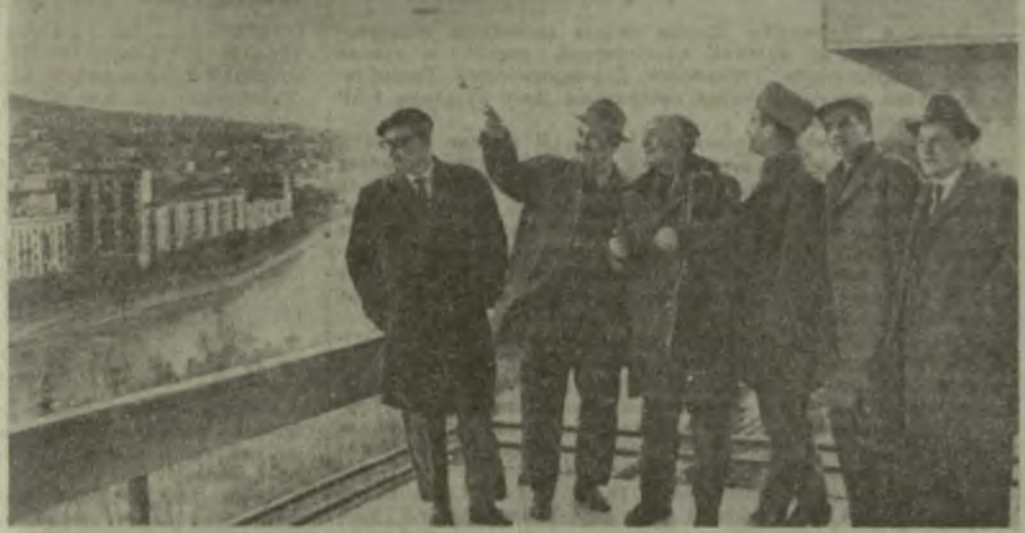
Дрезденский симфонический оркестр — в Тбилиси. Уже состоялись первые встречи, первое знакомство с нашей столицей, с ее жителями. На снимке: группа руководителей «Штаатскапелле» и представители грузинской музыкальной общественности на веранде гостиницы «Иверия».