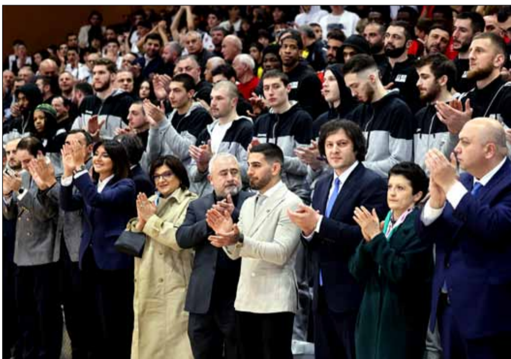
სთვის, რომელიც ჩვენს ქვეყანას მოუტანა, - განაცხადა პრემიერმა.

კიდევ ერთხელ მინდა მოგესალმეთ რუსთაველებს, მოგილოცოთ დღევანდელი დღე. კიდევ ერთხელ მინდა ხაზი გავუსვა იმას, რომ დღეს გვაქვს გამოორჩეული დღე სხვადასხვა თვალსაზრისით და პირველ რიგში