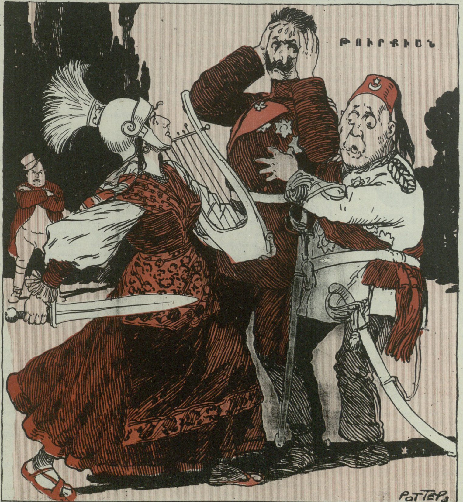
Սուլթանը դիմերով Վիլհելմին.— —Հողուտ մեռնիմ, ասա էտ դազազաձ աղջկան, որ ինձանից ձեռք վերցնի. ախար նրան ինչ, թէ իմ տէրութեան մէջ կոնստիտուցիան թղթի վրայ կրլինի, թէ կեանքի մէջ.

Գիկնի է 10 կ. Գաւառներում 12 կ. 1911, Շաբաթ, ՅՈԿՏԵՄԲԵՐԻ 15-ին. Թիֆլիս, №42.