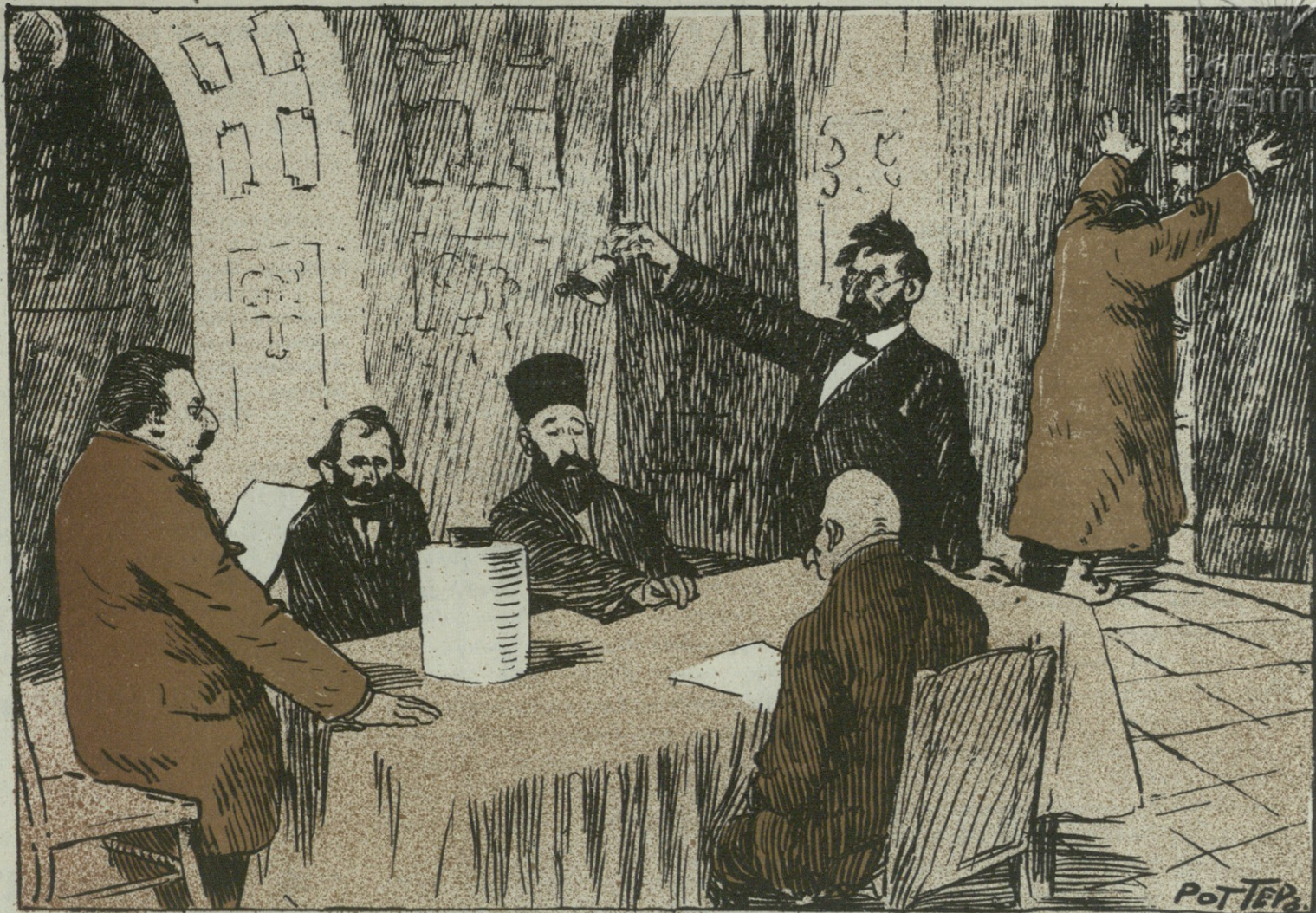
Ժխական ժողովի արձանագրութիւն.—

Ծխական ժողովը ընտրեց պատւիրակ մեծ. պարոն այսինչ ...եանցին և պարտաւորեց մանգանտով իր քւէն տալ այն պատգամաւորին, որ մեր սրտի թարգմանը կըլինի: