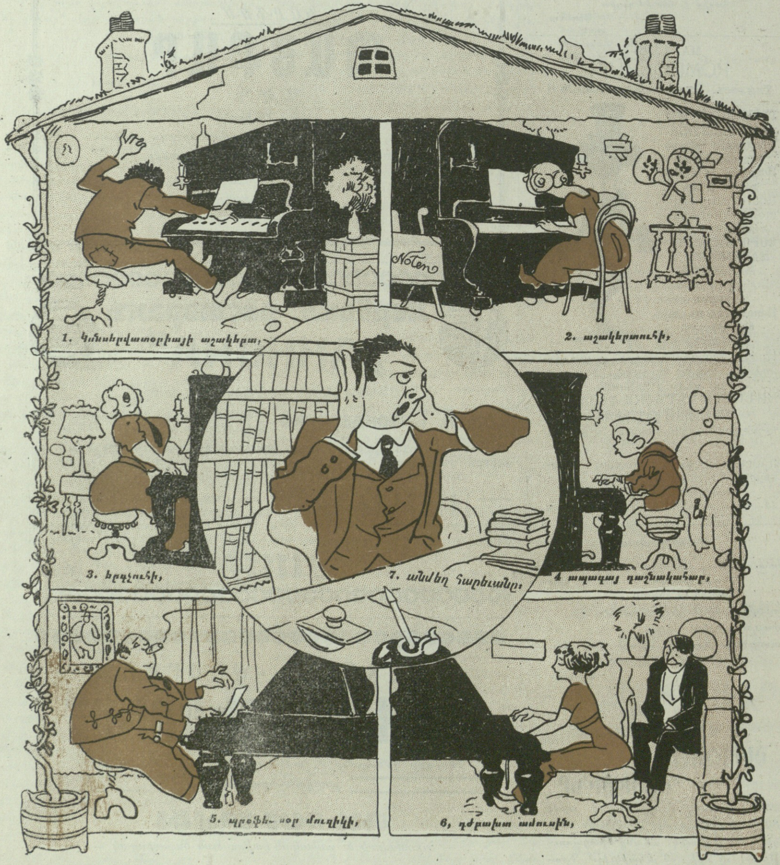
1. Կանսրվատորիայի աշակերտ,