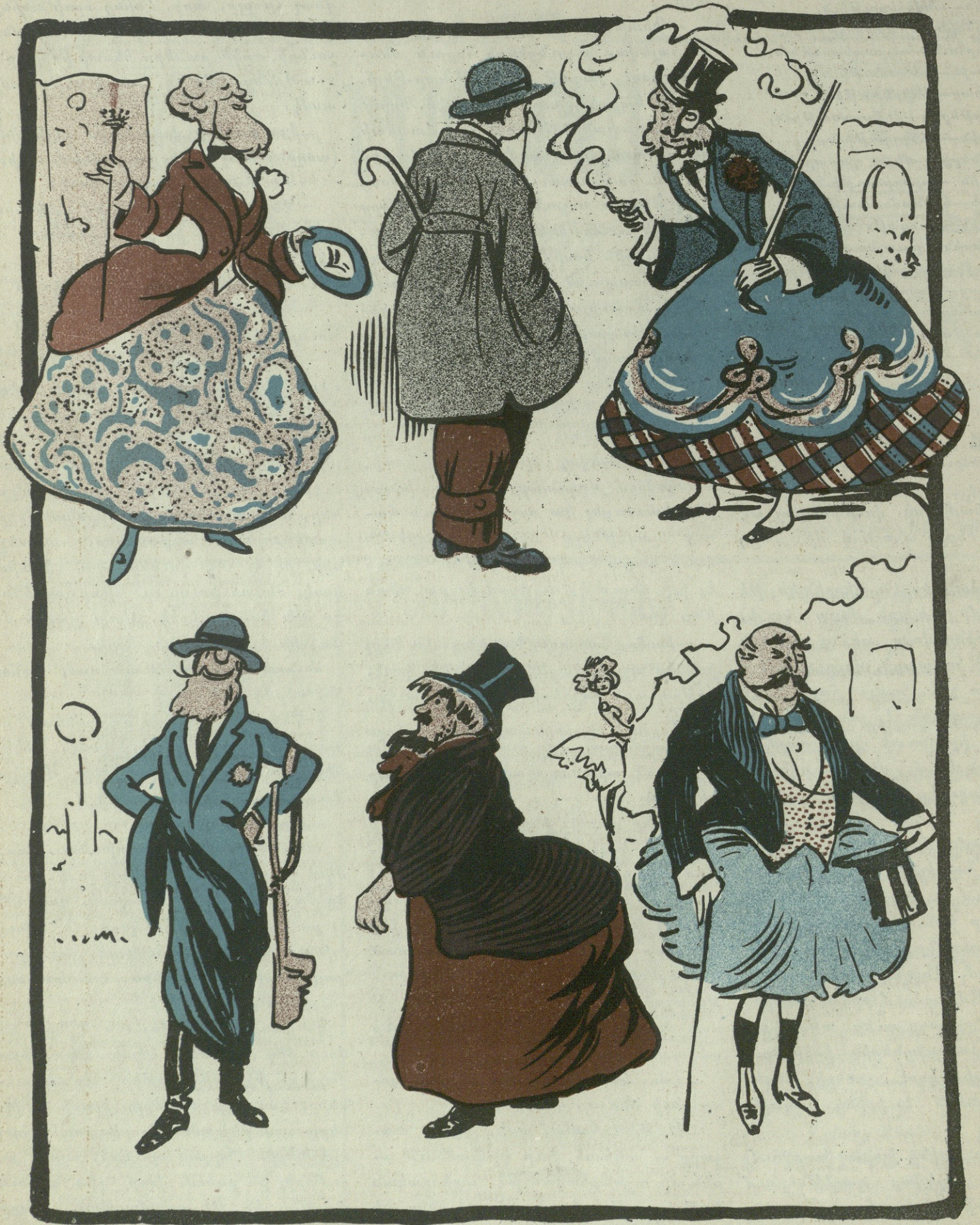
Յոյս ունենք, որ մեր ազամարդիկը շուտով այս ձևի զգեստ կընագնեն—նրանք արդէն կանացի ընոյթ ունեն: