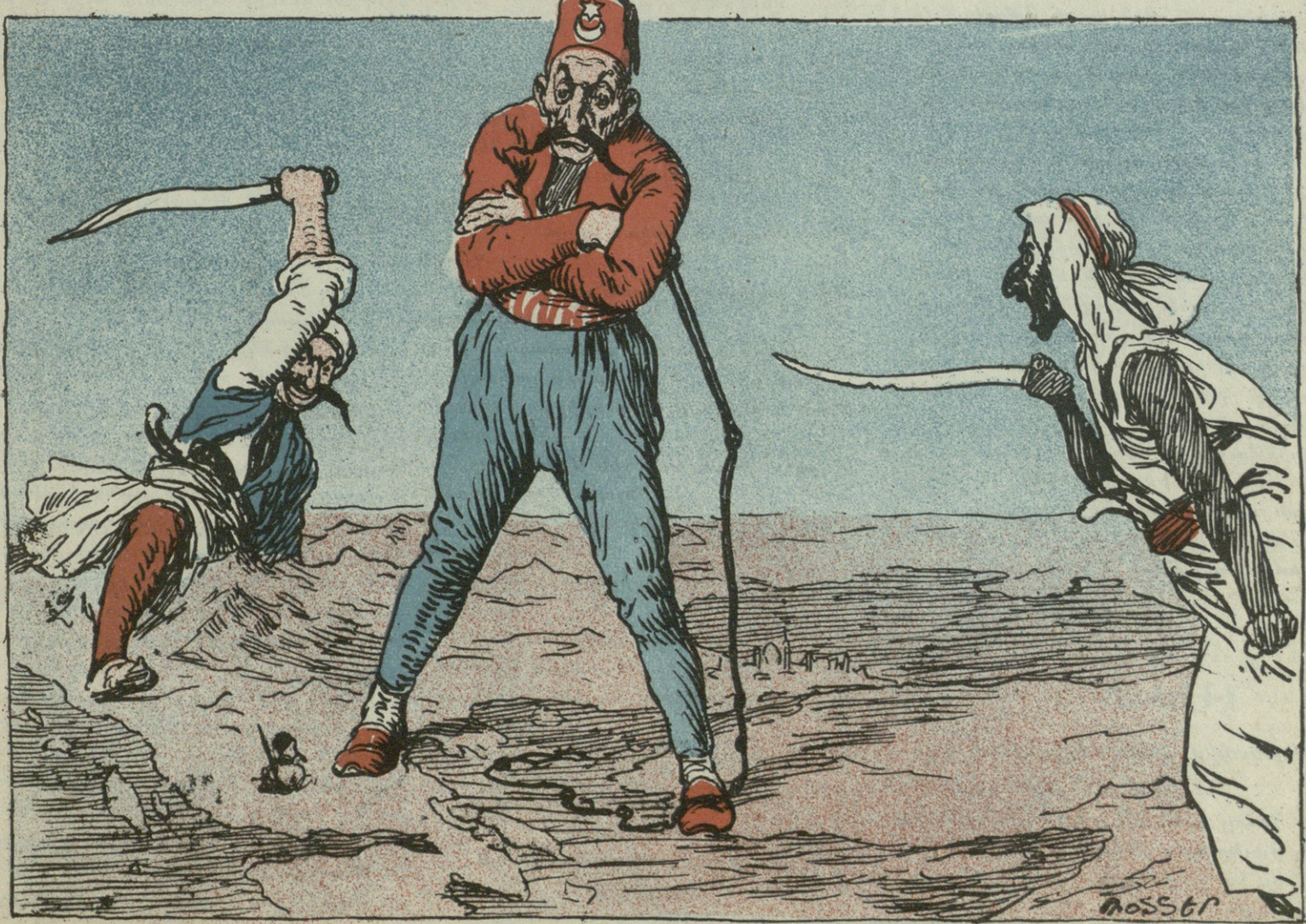
— Զանգը, քիչ անկու եմ՝ ինչո՞ւ էլ չգիտեմ — Ալբանիային սաստում եմ, Աբաբիան է ոտի կանգնում. Աբաբիային եզմում եմ՝ Ալբանիան է գլուխ բարձրացնում — էլ շաննիք էն միանեքը...