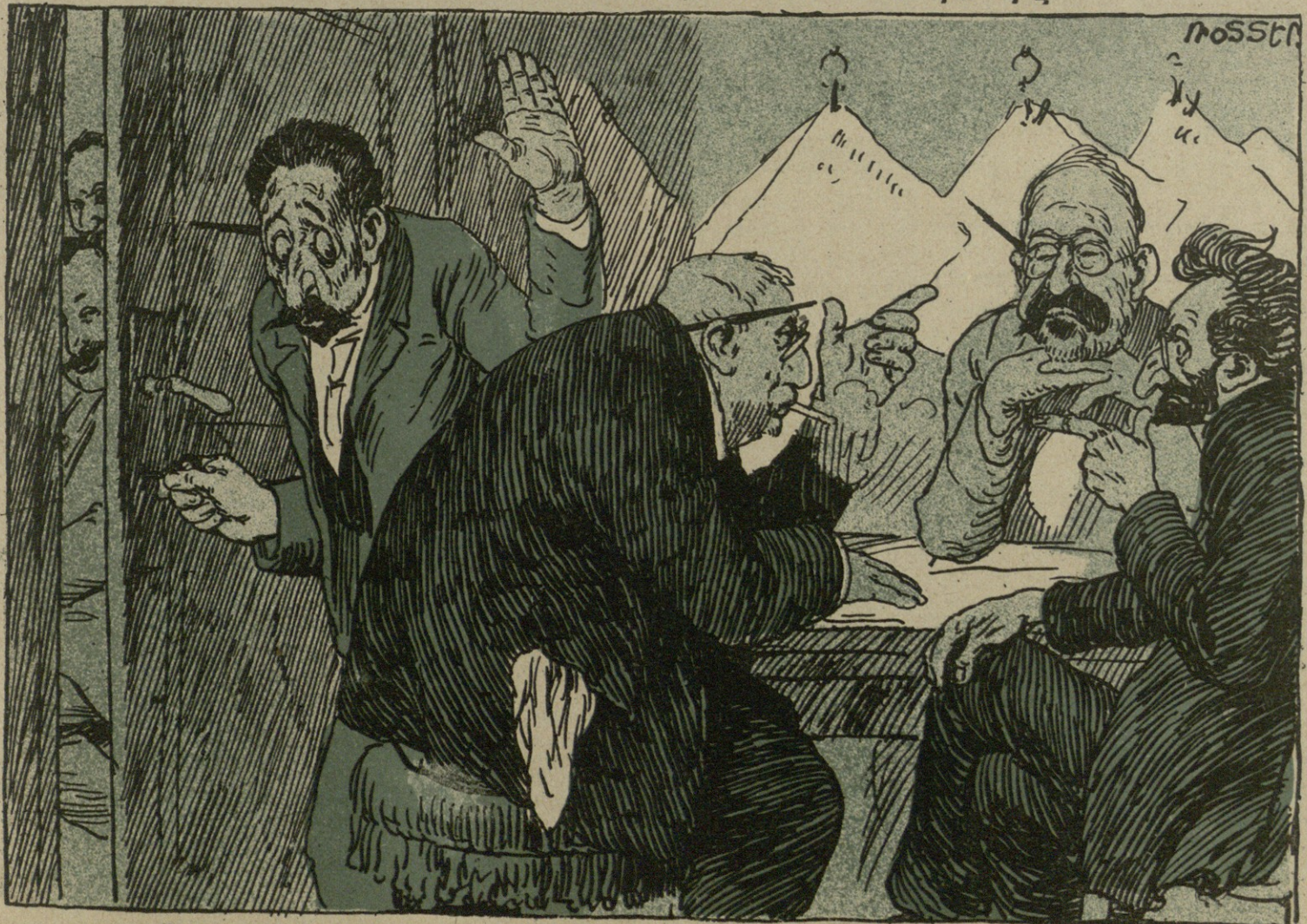
—Ս...ս... գուց փակէք, թող ոչ ոք չիմանայ թէ ինչ ենք անում: —Մեր գործընկերները պէտք է որոշ լինի. —Բողոքովին ո՛չ. մենք պէտք է ժամանակի ոգին իմանանք—երբ կղերականութիւնը ուժեղանում է պէտք է կղերական դառնանք՝ երբ ազատամտ... ազատամտ, երբ խուլիզանութիւնը... —Էվրիկա... խուլիզան պիտ դառնաք. ս... թող ոչ ոք չսէ. դա շատ լաւ կըլինի: Դա մեր դերը պիտ լինի. ժամանակը այդ է պահանջում: