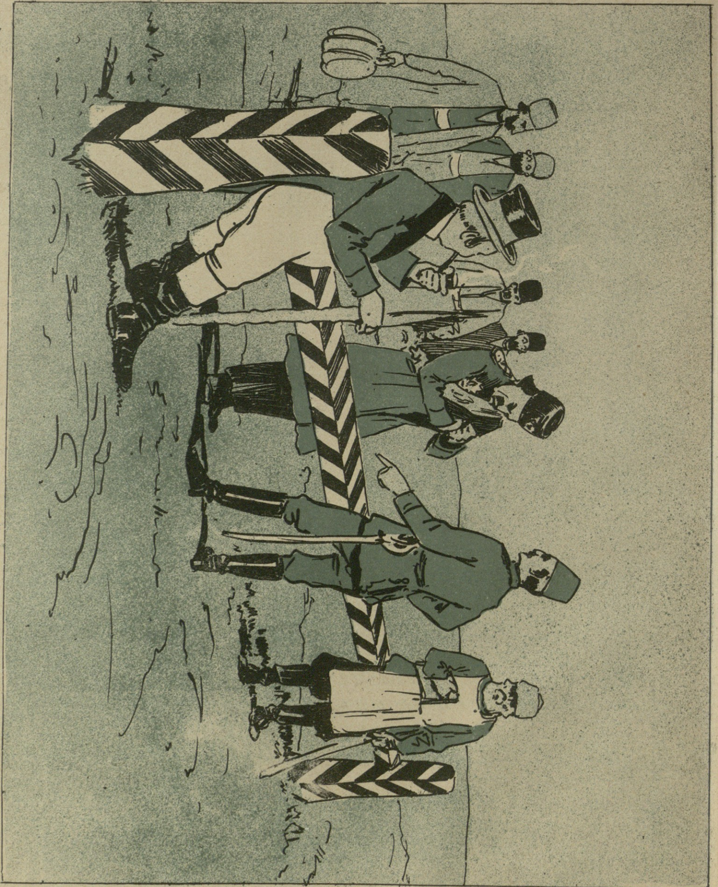
გადასასვლელი სარკინიგზის ხაზის გაშენების შესახებ...