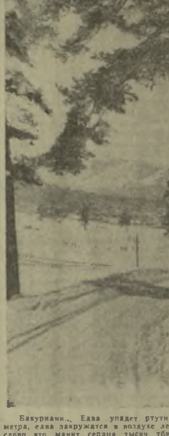
Бакуриани... Ева упадет ртутный столбик термометра, ева закружится в воздухе...