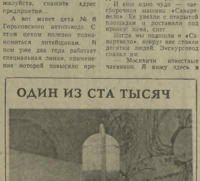
Макет строящейся на полуострове Мангышлак атомной электростанции с реактором на быстрых нейтронах.