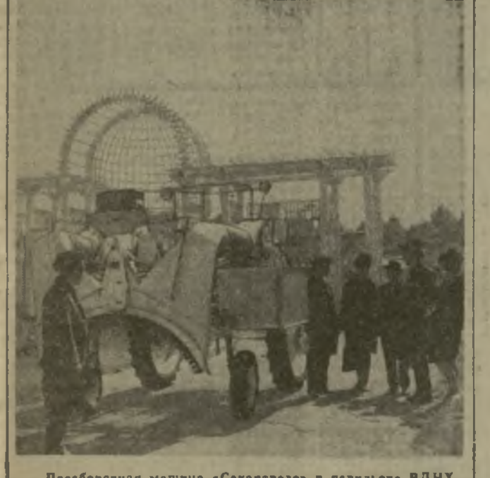
Чаесборочная машина «Сакартвело» в павильоне ВДНХ.