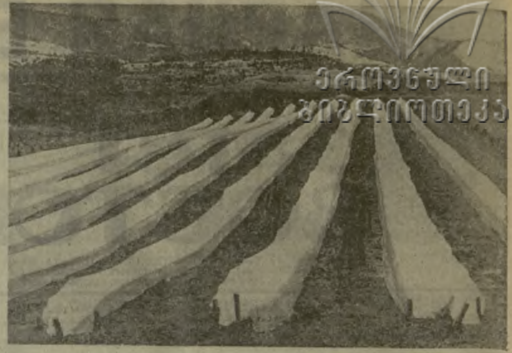
В селе Нариджовия расширяются угодья опытного хозяйства Сукумского филиала Всесоюзного научно-исследовательского института чая и субтропических культур.