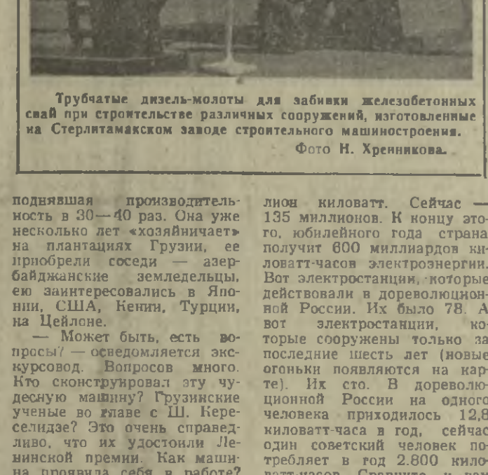
Трубчатые дизель-молоты для забивки железобетонных свай при строительстве различных сооружений, изготовленные на Стерлитамакском заводе строительного машиностроения.