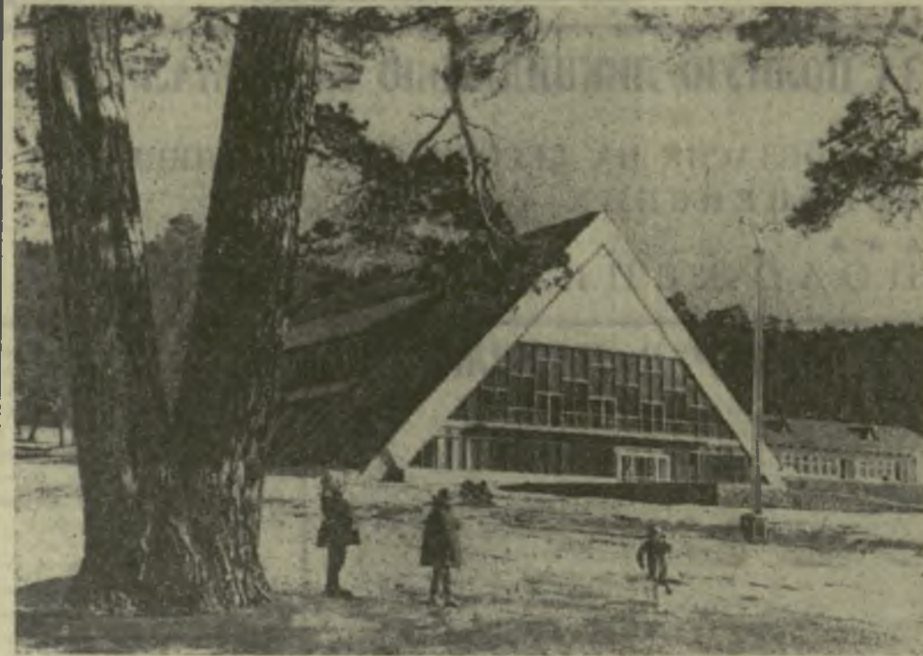
Неповторимо красива зимняя Бакуриани. Снежные горы и долины, теплое зимнее солнце...

36 НОВЫХ ЧАЙНЫХ ФАБРИК НА ЗЕМЛЕ ДРУЗЕЙ • ТРИУМФ СОВЕТСКОГО ГРУЗИНСКОГО БАЛЕТА, — ГОВОРЯТ ЗАРУБЕЖНЫЕ ЗРИТЕЛИ • КЕРАМИЧЕСКИЕ ИЗДЕЛИЯ КОЛХОЗНЫХ УМЕЛЬЦЕВ • БОЛЬШОЙ РАЗГОВОР О МУЛЬТИПЛИКАЦИИ