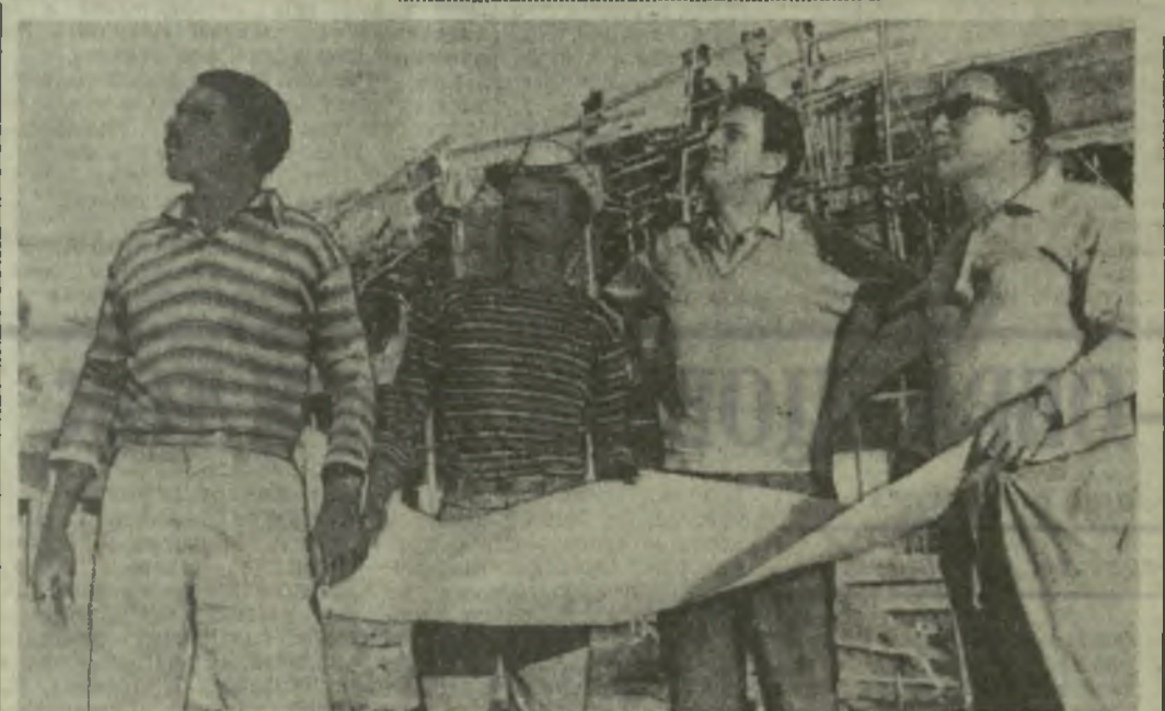
В центре Адак-Абды сооружается музыкальная школа — подарок болгарского правительства Эфиопии. На снимке: специалисты из НРБ и местные инженеры на строительной площадке.

ПЛАНЫ АМЕРИКАНСКОЙ ВОЕНЩИНЫ ПРОТИВ ВОЗВРОБЛЕНИЯ ДОГОВОРА НАТО