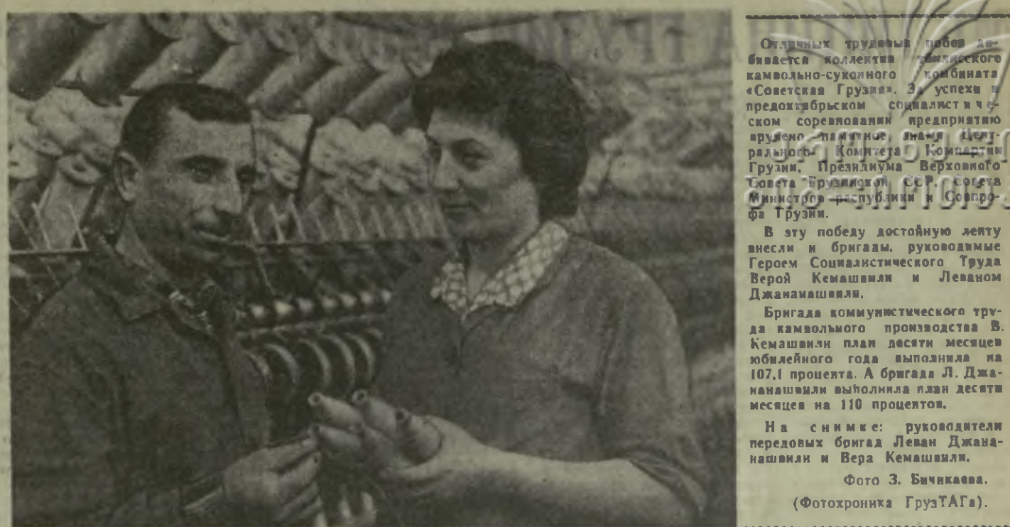
Отчетный трудящийся... бивается коллегам... «Советская Грузия»... успехи в предоктябрьском социалистическом соревновании...