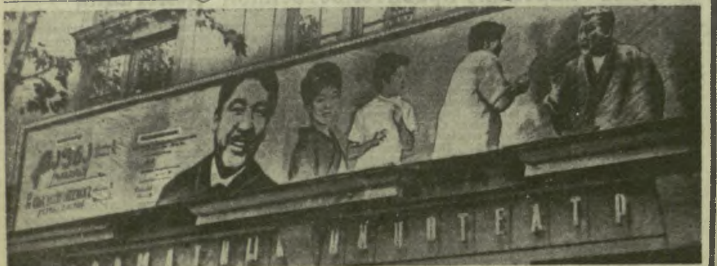
Фестивальная реклама японских фильмов в кинотеатре Руставели.

В первый день фестиваля были продемонстрированы документальные и художественные фильмы «Традиционное прикладное искусство Японии», «Бунарику — японский музыкальный театр» и «Куропатка», художественные фильмы «Дэфна» («Зинчге») и «Наша беззащитная любовь» («Отцы и дети»). (ГрузТАГ).