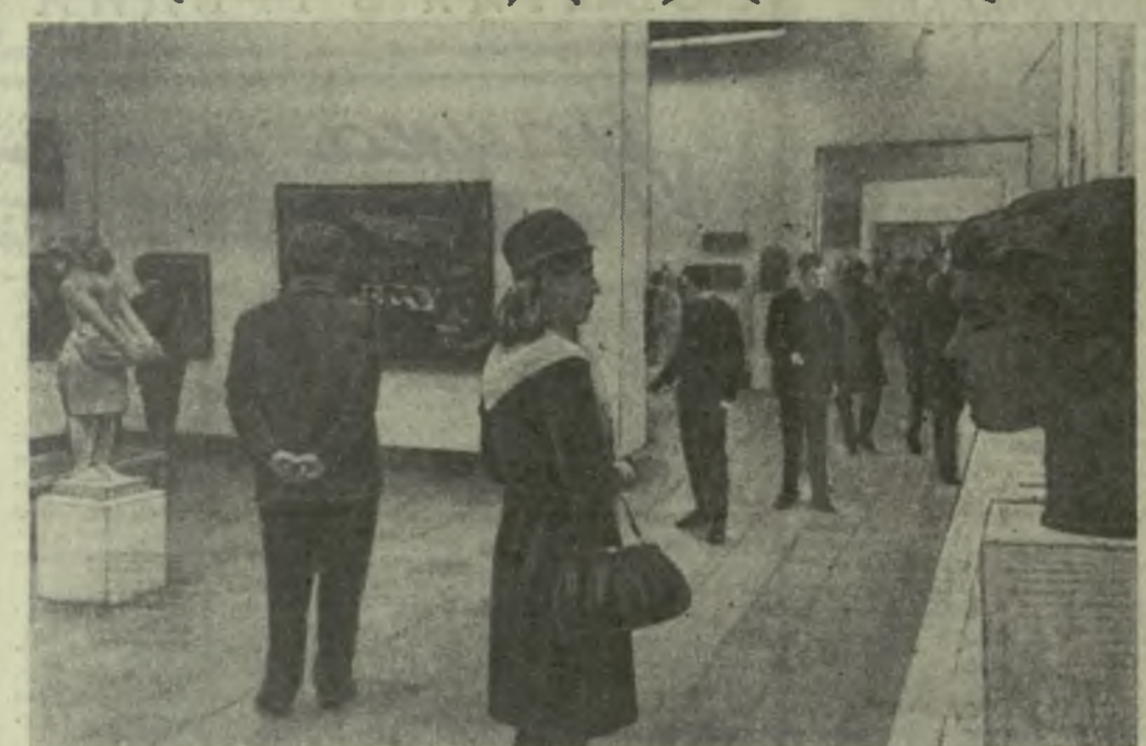
Москва. Центральный выставочный зал. Экспозиция художников Грузии на Всесоюзной юбилейной выставке изобразительного искусства.

Потом выступали многочисленные гости, видные мастера искусств, и все они говорили об огромном шаге вперед, о небывалом взлете изобразительного искусства, достигнутом в нашей республике. Доказательством этого творческого взлета, говорили они, служат вели-